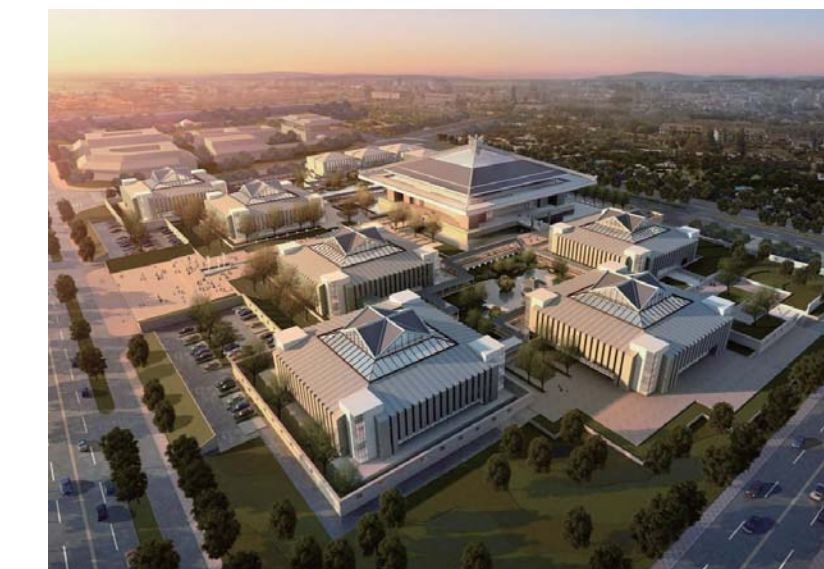
△孔子博物馆效果图