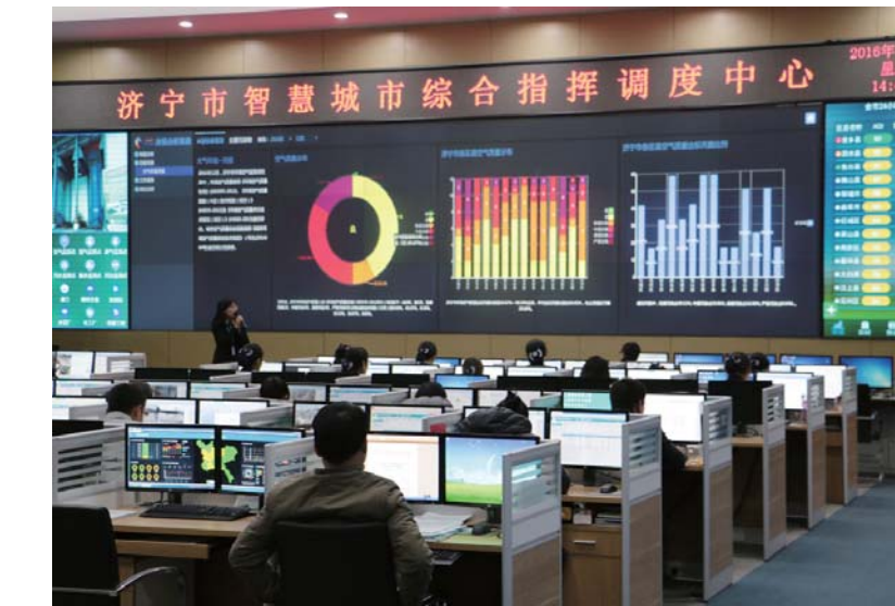
△济宁市智慧城市综合指挥调度中心