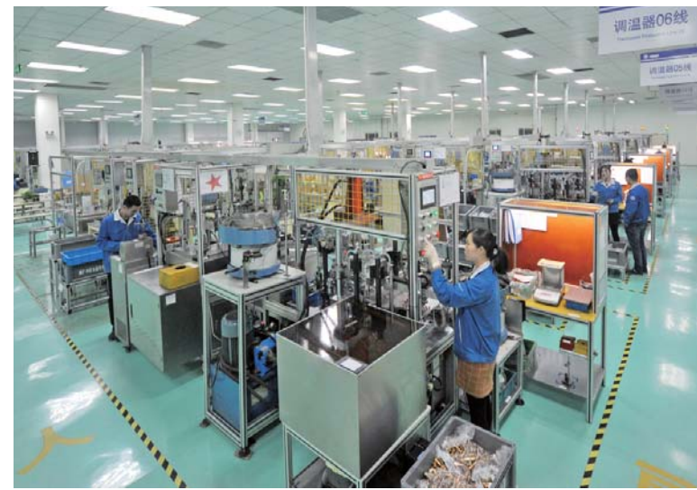
△与两家公司500强合作企业——天peng汽配

信息产业实现高端起步、跨越发展，实施了信息产业跨越发展“三年行动计划”，美国惠普、甲骨文、IBM、华为、中兴通讯等一批国际知名IT企业集群落户。近两年，济宁市信息产业主营业务收入保