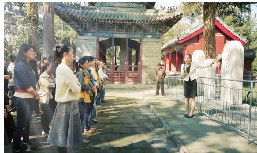
△政德教育培训班学员在蓝厅参加现场教学

◆推进产业转型升级，主要经济指标增幅高于全省平均水平 ◆弘扬优秀传统文化，倾力构筑首善之区文化强市 ◆八成财力投向民生领域，推动民生保障十大体系建设 ◆以国家生态保护和建设示范区为战略统领，加快绿色生态济宁建设