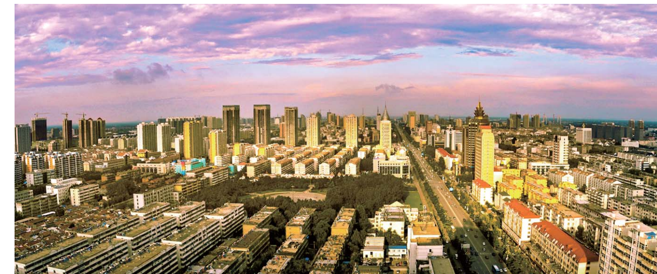
△高楼林立的济宁城区