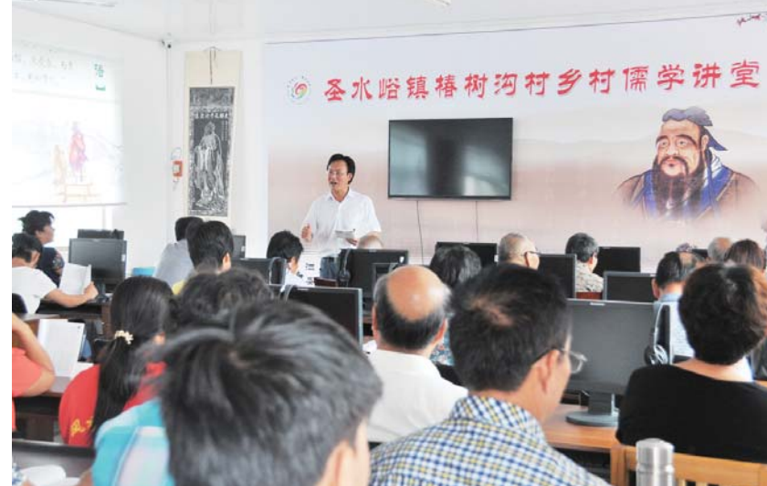
△济宁广泛开展乡村儒学讲堂活动