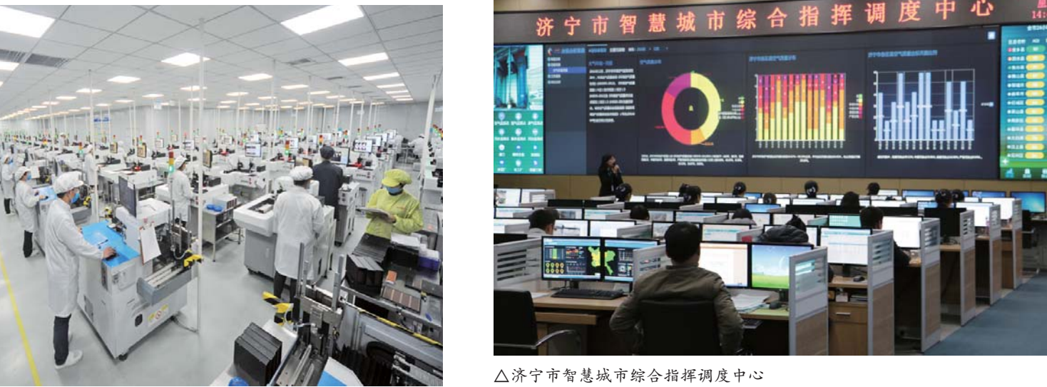
△济宁市智慧城市综合指挥调度中心

始终把大气污染防治作为重大民生工程，精准施策整治大气污染取得显著成效。在全省率先构建行业技术导则体系。针对建筑工地扬尘、煤矿码头堆场等面源污染严重、治理标准不统一、防治设施不规范等问题，协调相关市直部门相继出台实施了9类行业治污技术导则；并配套出台了实施方案、考核办法，每月对工作落实情况通报排名。目前，纳入导则体系进行整治的污染源达到3284家。坚持提标改造，深化工业点源治理，已完成82台燃煤机组（锅炉）的超低排放改造，超过年初预定目标任务8倍。在全国首创“城市大气环保管家”决策支撑体系。在济宁城区周边布设了175个空气自动监测微站，编制完成济宁市大气污染防治清单，建立了动态更新的排放清单云平台管理系统；开发了济宁市空气质量预报和重污染应急管理评估系统。总预算投资2亿多元，在乡镇及化工园