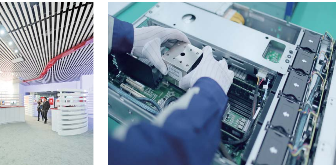
△英特尔自主高性能服务器芯片

总投资8亿元的孔子博物馆主体工程竣工，1995年国家和省领导提出的建设孔子博物馆的期望变为现实，投资100亿元的省重点项目尼山圣境进展顺利，一期工程项目建成运营。与此同时，文化旅游