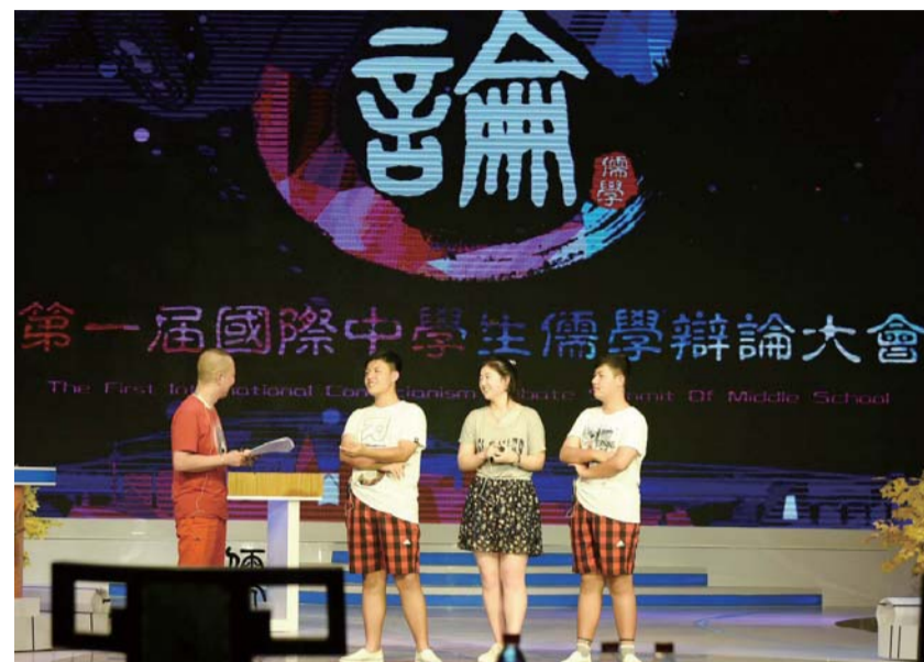
△第一届国际中学生儒学辩论大会