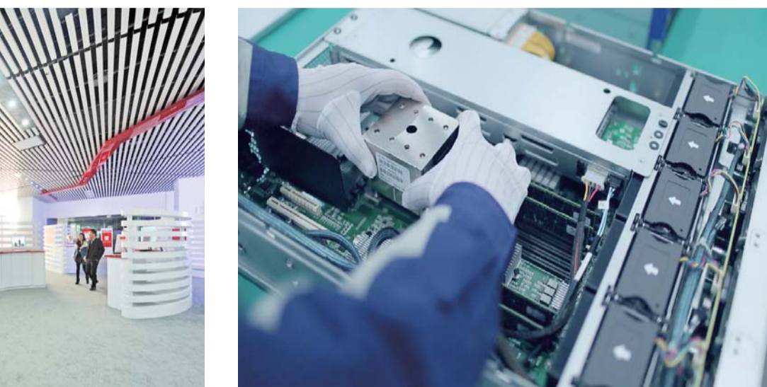
△英特尔自主高性能服务器芯片

令人欣喜的是，济宁重点文化工程项目建设有了重大突破。投资3.5亿元的“三孔”古建筑彩绘保护维修工程全面启动，这是自1730年（清雍正8年）“三孔”古建筑群抢救性大修后，280多年来“三孔”古建筑彩绘第一次系统性保护维修。故宫博物院在曲阜设立了故宫博物院分院，国家文物局在济宁设立了明清官式建筑研究与保护重点科研基地。总投资8亿元的孔子博物馆主体工程竣工，1995年国家和省领导提出的建设孔子博物馆的期望变为现实，投资100亿元的省重点项目尼山圣境进展顺利，一期工程项目建成运营。与此同时，文化旅游