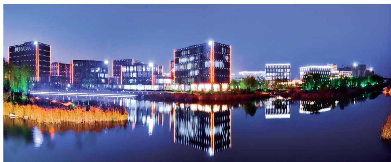
△高新区产学研基地