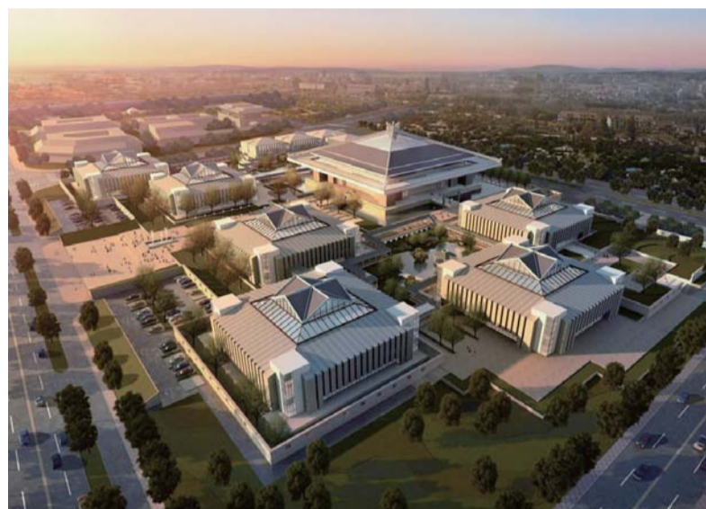
△孔子博物馆效果图