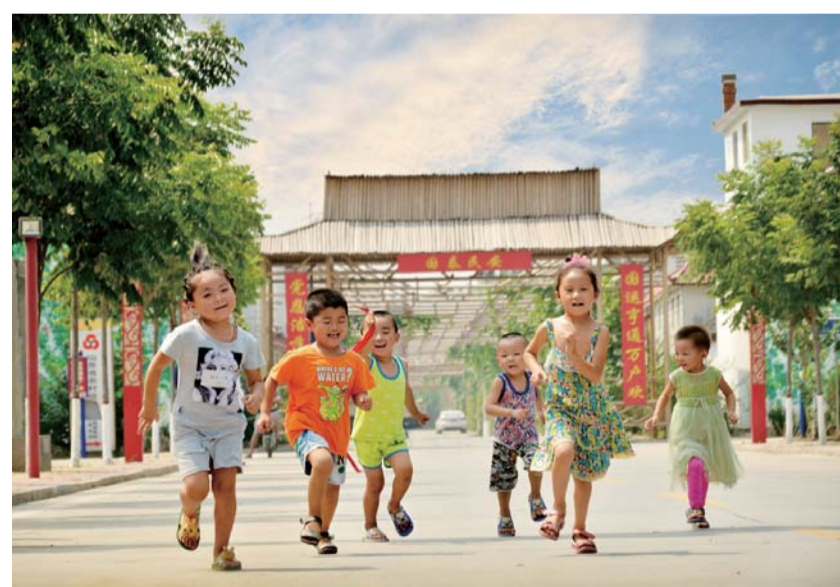
△奔跑在幸福大道上