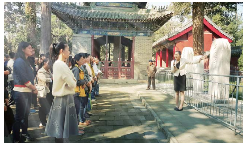
△政德教育培训班学员在蓝厅参加现场教学

◆推进产业转型升级，主要经济指标增幅高于全省平均水平 ◆弘扬优秀传统文化，倾力构筑首善之区文化强市 ◆八成财力投向民生领域，推动民生保障十大体系建设 ◆以国家生态保护和建设示范区为战略统领，加快绿色生态济宁建设