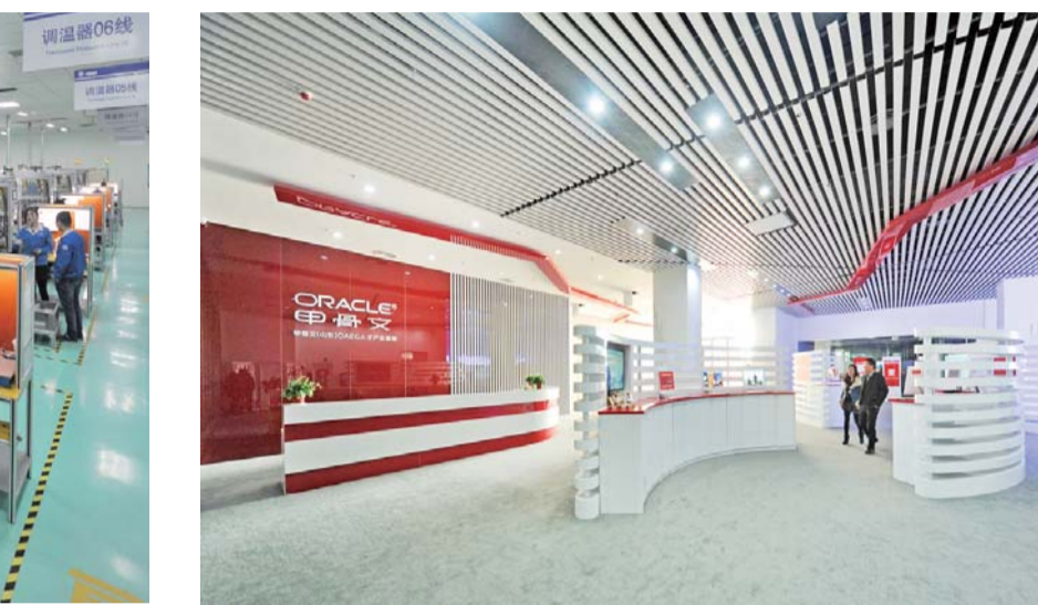
△甲骨文人才产业基地

造“道德建设模范区、文明和谐示范区、儒家文化传承区”，充分发挥传统文化、传统美德在促进社会主义核心价值观体系建设中的基础性作用，结合创建全国文明城市，实施优秀传统文化六进普及、道德提升、文明创建等七大工程，创新推出图书馆+书院、“孔子学堂”、尼山书院国学公开课等公共文化服务模式，开展了儒学进乡村活动，在农村和城市社区普遍设立善行义举道德模范宣传栏，有效激发了全社会崇德向善的力量，“乡村儒学讲堂”现象在全省引起广泛关注，中宣部、省委宣传部分别在济宁召开推广善行义举现场会，“山东乡村儒学现象”座谈会。