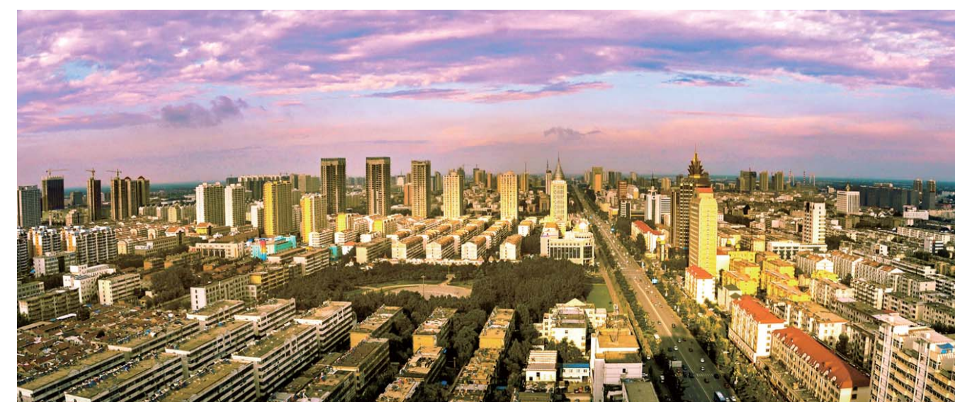
△高楼林立的济宁城区