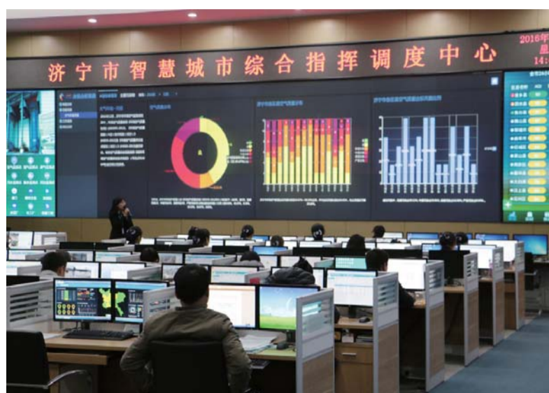
△济宁市智慧城市综合指挥调度中心