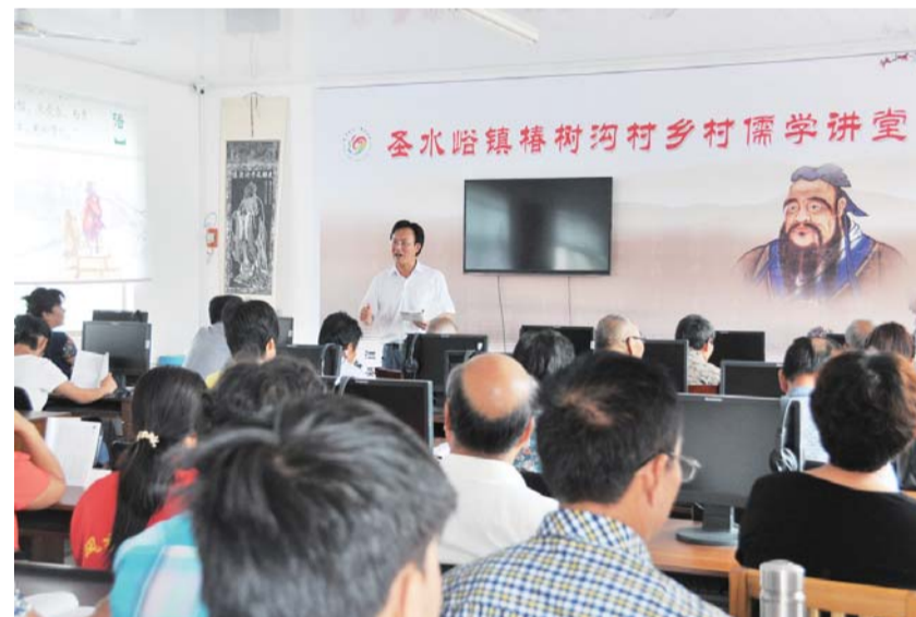
△济宁广泛开展乡村儒学讲堂活动