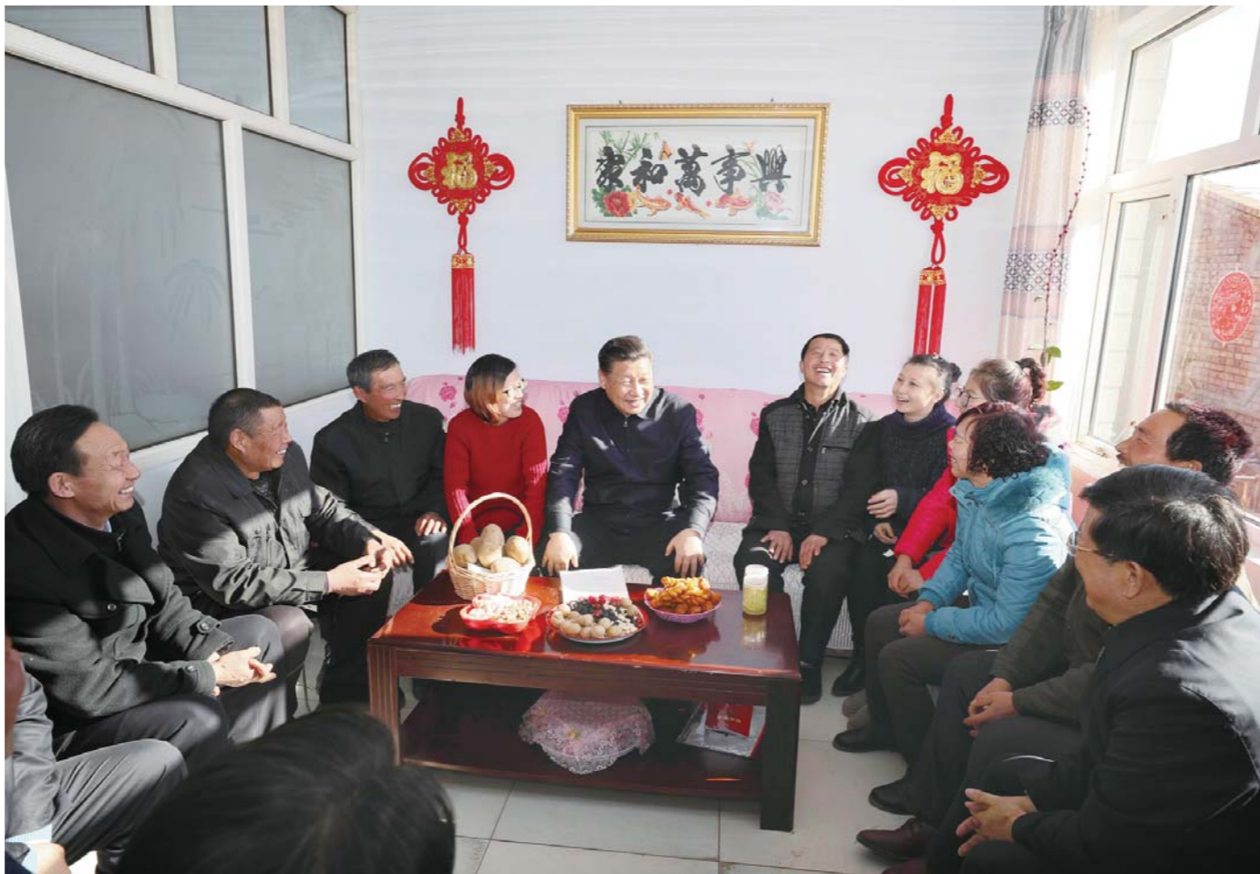
1月24日,习近平在张北县小二台镇德胜村徐海成家同村干部和村民代表座谈。

在徐学海家,得知徐学海去年因心脏病手术负债4万多元,并且不能再干重活,习近平安慰他好好养病,鼓励他乐观坚强,嘱咐当地干部深入研究因病致贫问题,采取及时有效的帮扶措施。徐学海请总书记同他们一起炸年糕。(下转第三版)