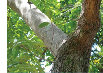
▲降香黄檀的树干和树叶形态(拍摄于海南)

降香黄檀在我国的应用历史十分悠久,早在唐代的《本草拾遗》中就记载“花榈出安南及南海,用作床几,似紫檀而色赤,性坚好。”清代刊本《琼州府志》中“花梨木,紫红色,有微香,产黎山中。”除了制作家具、工艺品及香料外,降香黄檀的树干和根的干燥心材降香还为我国传统中药,其有效成分的药理具有抗氧化作用、保护心血管作用、抗血小板聚集作用、抗炎作用、抗过敏作用、中枢神经抑制作用和酪氨酸酶活化作用等,所以降香黄檀的心材具有行气活血、止痛、止血之功效,是良好的镇痛剂,多用于心胸闷痛、腕腹疼痛、跌扑损伤、外伤出血的治疗,且常与其