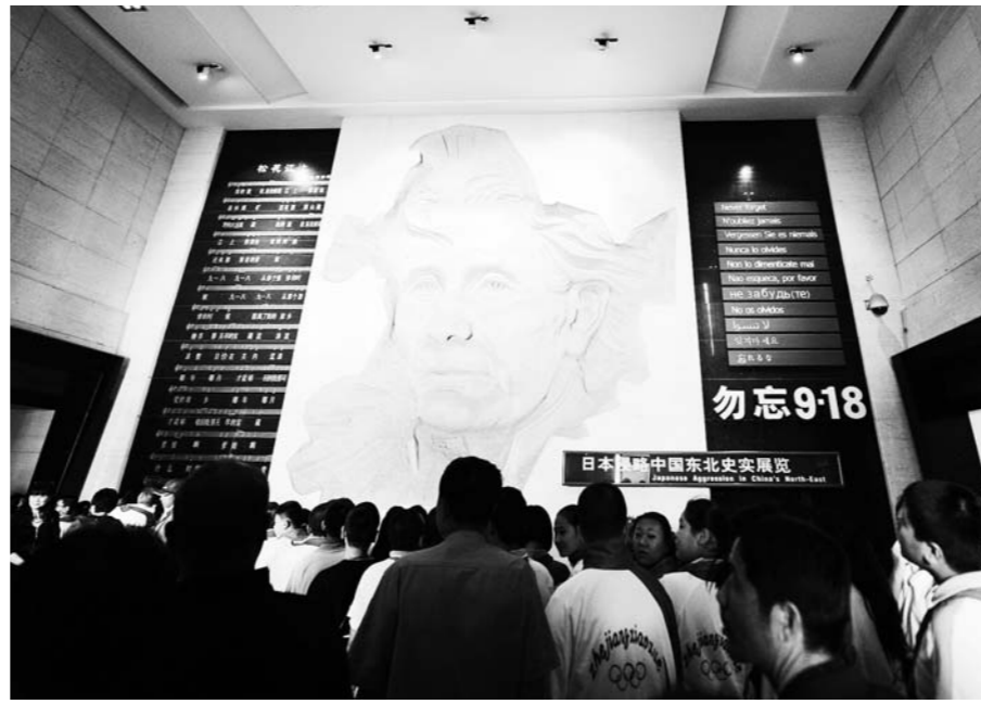
2016年9月18日，长春市民来到长春伪满皇宫博物院东北沦陷史陈列馆参观。

教育部近日下发文件，规定2017年春季教材将全面落实“十四年抗战”概念。“八年抗战”一律改为“十四年抗战”，从1931年“九一八事变”算起，至1945年日本无条件投降。历史类教科书的修订关乎民族记忆、青少年爱国主义教育，意义重大，山东是怎么落实的？