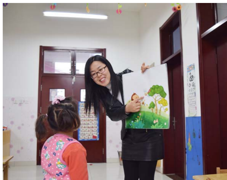
羊口新区幼儿园 教师，在向孩子讲述 图画故事。