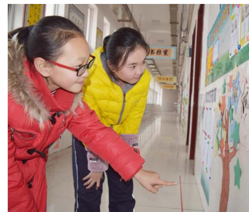
□石如宽 报道 古城街道北洛小学，两名学生在欣赏走廊内同学的作品。