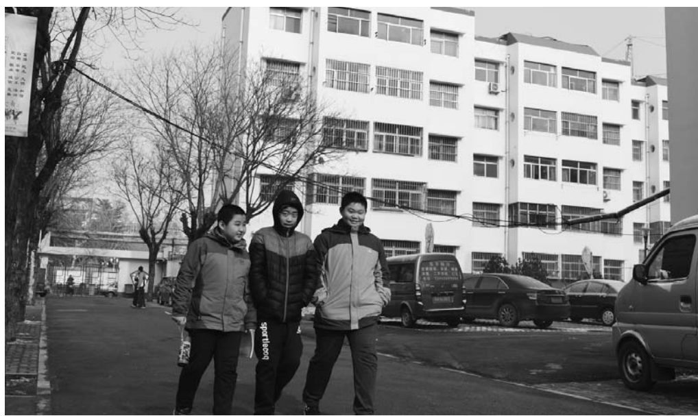
1月1日，三名中学生走在改造后的寿光市圣城街道三里小区。