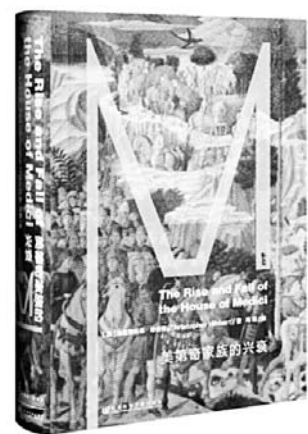
《美第奇家族的兴衰》 [英] 克里斯托弗·希伯特 著 社会科学文献出版社