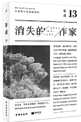
《消失的作家》 吴琦 主编 台海出版社

好社会就像好房子，听费孝通向世界讲述“中国故事”，重释何为“美好社会”——大时代里的一个书生，在外界巨变与历史动荡中力图持续内心的写作，其终极求索，是接通心底那个叫“中国文化出路”的大题目，探寻社会如何能更好。