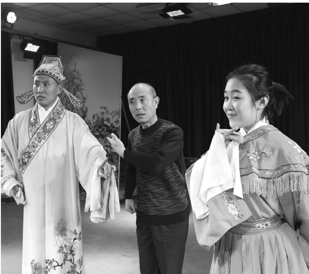
□王建彬 高占根 报道

关在象牙塔里不会有持久的文艺灵感和创作激情。离开人民,文艺就会变成无根的浮萍、无病的呻吟、无魂的躯壳。一切有抱负、有追求的文艺工作者都能自觉地追随人民脚步,走出方寸天地,阅尽大千世界,让