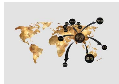
▲伊美尔中韩分支机构(包括在建机构)

伊美尔，成立于1997年，是国内较早从事专业医疗美容、临床、科研、教学为一体的大型整形美容连锁集团。目前涵盖整形美容、抗衰老、生活美容、减脂体雕、中医美容、口腔美容、毛发移植等多种医疗服务，在韩国、北京、天津、济南、青岛、哈尔滨、西安等地拥有多家分支机构。