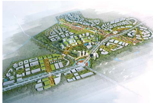
△创意家居小镇规划