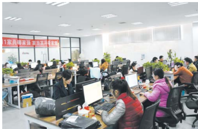
△天华电商产业园区内的电商企业在迎接“双11”来临