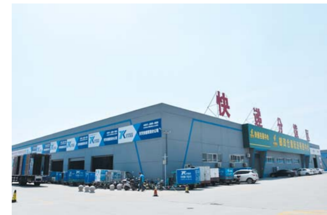
△天华电商产业园为企业提供全方位物流服务

天华电商产业园总经理褚夫忠介绍说，拉动产业增长才是电商发展的落脚点，园区将实现菏泽市委书记孙爱军提出的“四个引领”的功能，即引领商贸物流业升级、引领经济转型、引领实体经济发展和引领新型城镇化。