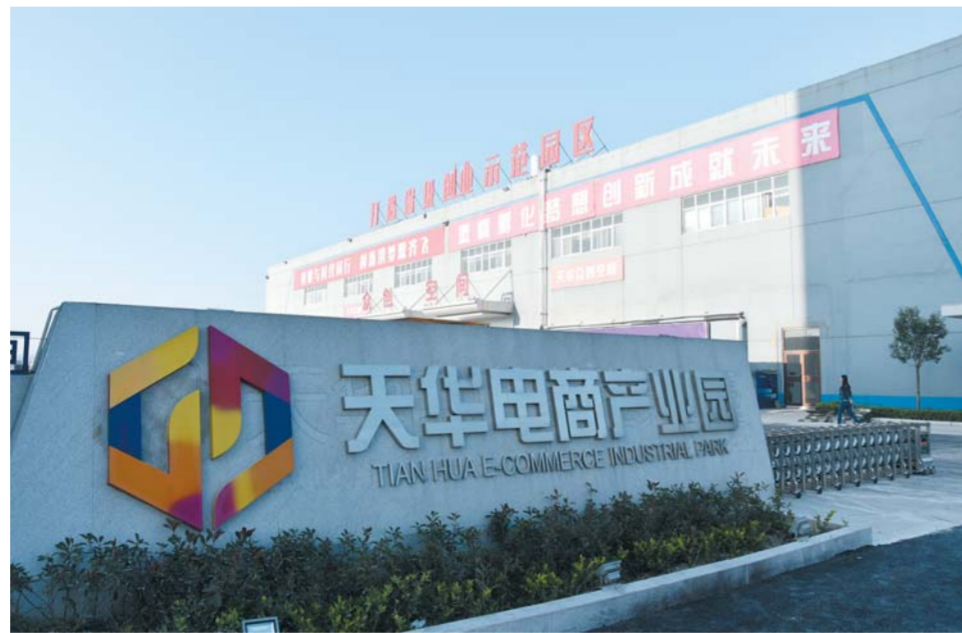
△天华电商产业园区内设有创业服务空间

天华电商产业园是在菏泽市和牡丹区两级党委政府支持下，由菏泽天华集团在原有闲置厂房基础上改建而成的集网商创业孵化、众创空间、电商运营、新媒体广告、线下体验、分拨配送及综合配套为一体的全功能电子商务产业园区。一年多来，园区承接了全市电商产业发展现场会、大项目观摩会