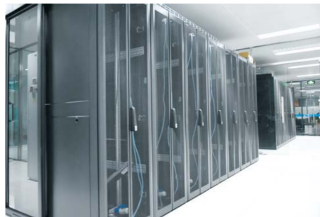
△为电商大数据提供坚实后盾的天华云