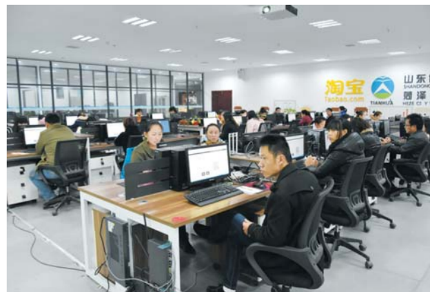
△优博商学院正在培训电商学员