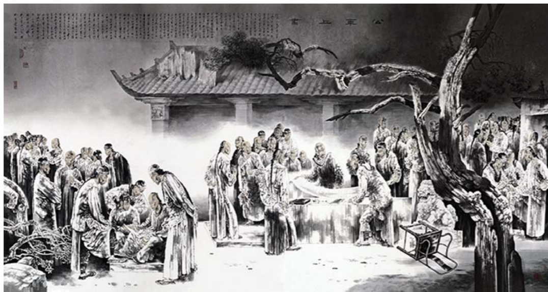
公车上书 308cm × 600cm

主办:山东省文化厅、山东省文联 承办:山东画院、山东美术馆、山东省中国画学会 时间:2016年12月17日至2017年1月15日 地点:山东美术馆