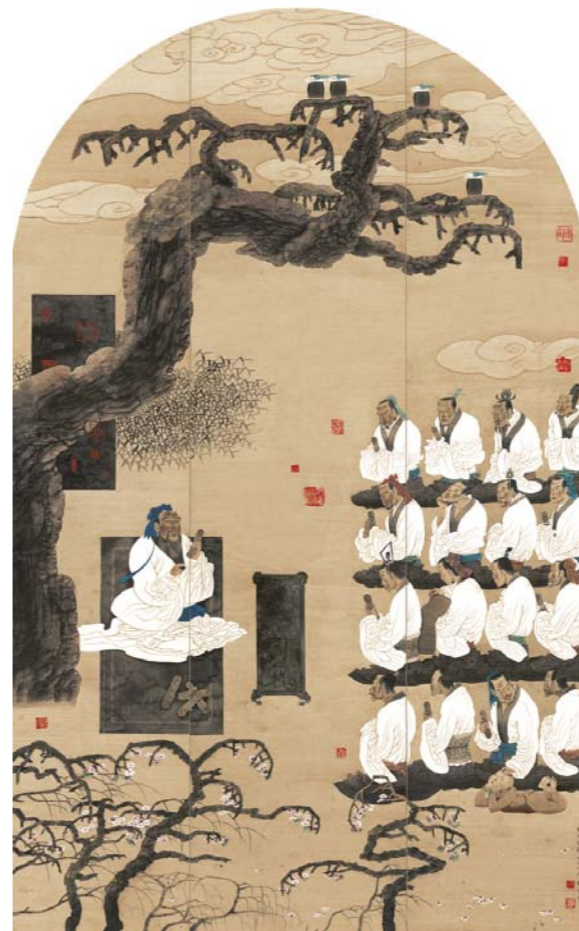
杏坛讲学 220cm × 143cm

孔维克 1956年生于山东省汶上县。现为全国政协委员、民革中央委员、中国统促会理事、民革山东省委副主委、世界孔子后裔联谊会副会长、中国美协理事、北京大学文化艺术研究所名誉所长、文化部中国艺术研究院特聘研究员、民革中央画院副院长、山东省文联副主席、山东省中国画学会会长、山东画院院长。