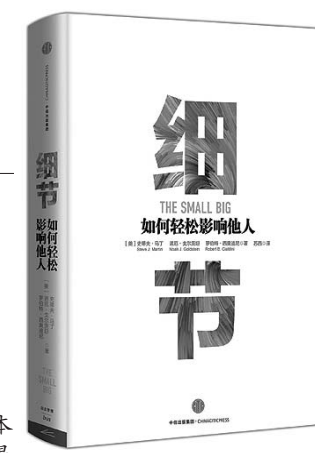
这本书讲的是如何用高效又符合伦理的方法来影响和说服他人。书中讲到了许多看似微小却十分关键的魔法能够改变现实(有50多条)，并且你马上就能拿来使用。

作为英国史上持续时间最长的内战，玫瑰战争是金雀花王室两大旁支兰开斯特家族与约克家族争夺英格兰王位的战争，周边国家和地区也被卷入这场巨大的政治漩涡，当战争结束时英国走入近代社会黎明阶段。