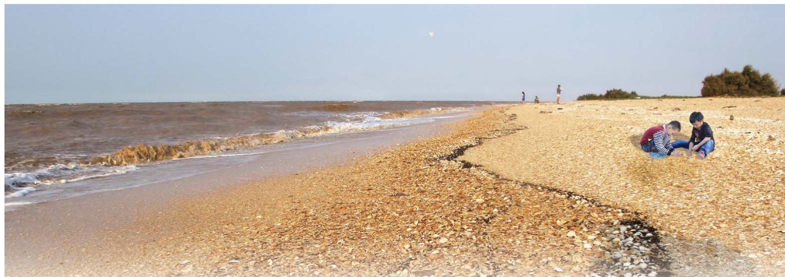
△无棣古贝壳堤吸引了众多游人