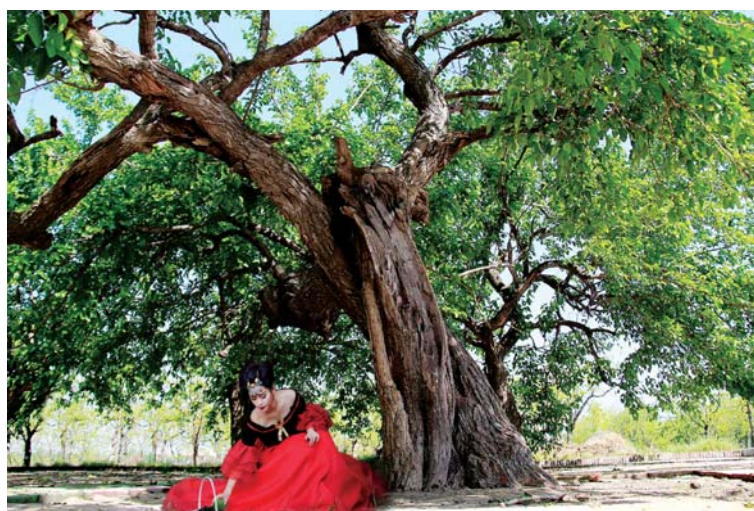
△位于车王镇的千年古桑风景区