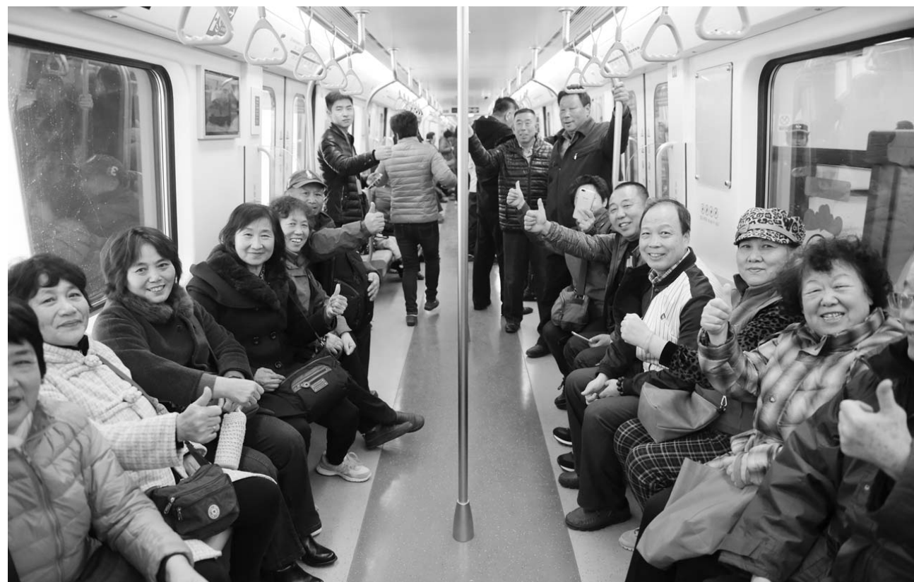
12月7日，青岛市民参与地铁3号线南段试乘体验活动。

“赶工期”的冲动也引起了主管部门的重视。在江西“11·24”事故发生后，省政府、省安委会、省住建厅连续召开安全生产紧急会议，部署吸取事故教训，做好年末岁初安全生产工作。省住建厅会议提出，临近岁末年初，大风、降温、雨雪、冰冻等极端天气增多，一些建设项目进入工期节点，部分企业赶工期，抢任务意愿强烈，一线作业人员