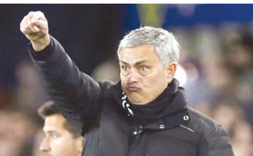
穆里尼奥在指挥比赛

北京时间12月5日，在2016-2017赛季NBA常规赛，俄克拉荷马雷霆队主场以101：92战胜新奥尔良鹈鹕队，取得五连胜。雷霆队当家球星拉塞尔·威斯布鲁克（上图）本场贡献了28分、17个篮板、12次助攻，连续5场打出“三双”，创下个人生涯连续“三双”的新纪录。此外，威斯布鲁克本场比赛还有10次失误，完成了另类“四双”。