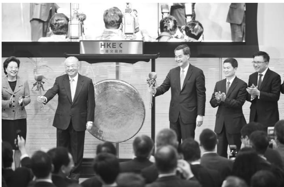
12月5日，香港交易所举行“深港通”开通仪式，香港特区行政长官梁振英（右三）与香港交易所主席周松岗（左二）共同为当日交易鸣锣开市。

□记者 李铁 通讯员 胡鑫 报道 本报济南12月5日讯 市场预期已久的深港通今日正式启动，但两地股市表现并不理想。收市时，沪指跌1.21%，深成指跌1.18%，恒生指数跌幅0.26%，仅有创业板指数小幅上涨0.02%。