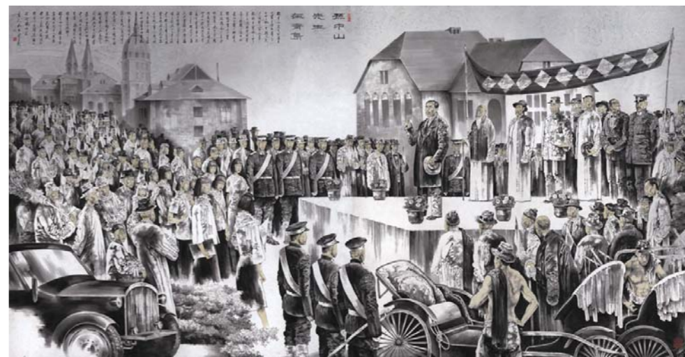
孔维克 孙中山先生在青岛