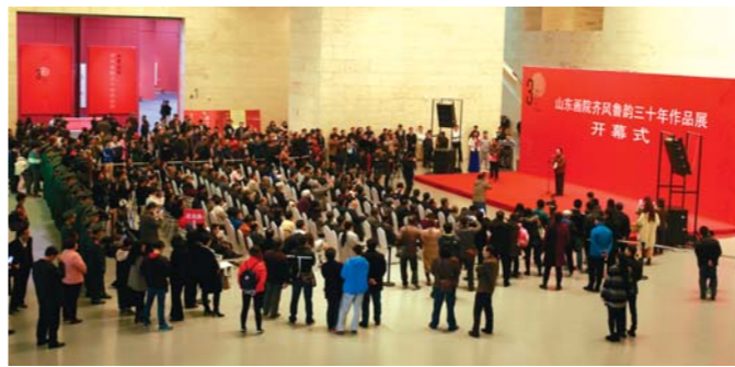
2016年11月19日,“流金岁月·山东画院齐风鲁韵30年作品展”在山东美术馆开幕。