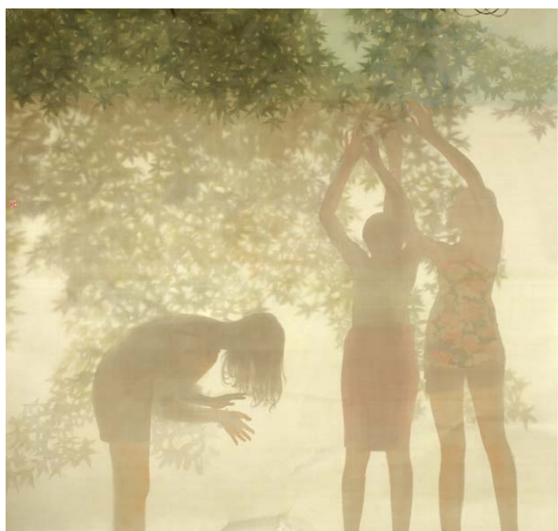
于磊 状态系列三 (国画)