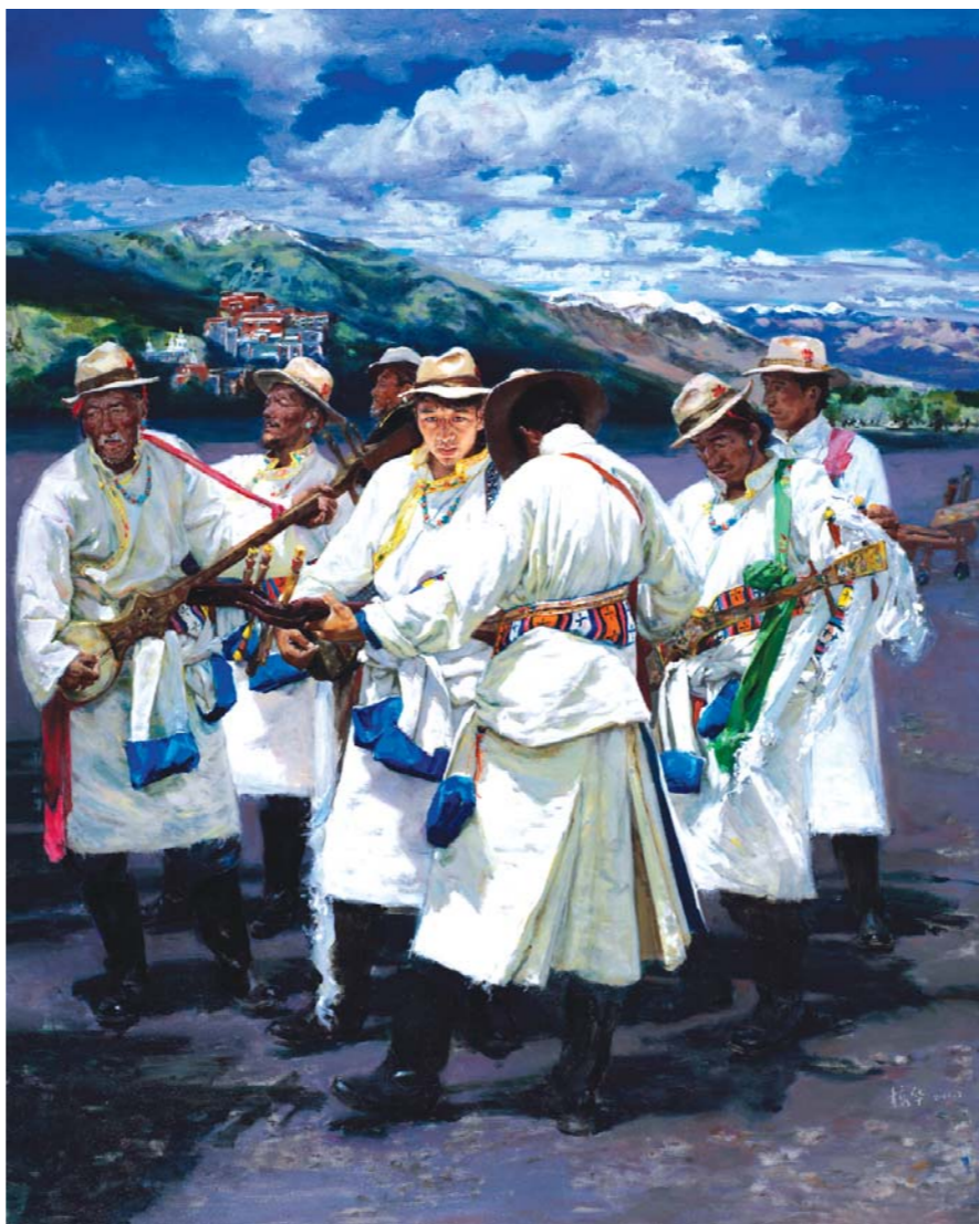
姚榕华 萨伽回响 (油画)