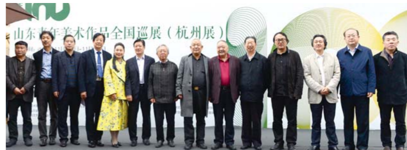
“学术100”杭州展于11月20日开幕