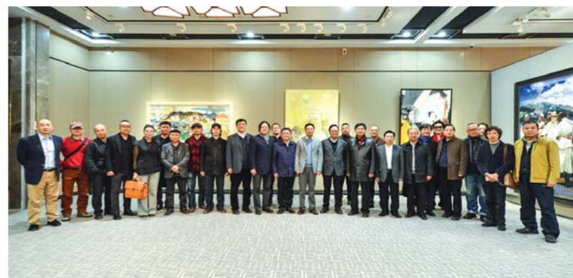
“学术100”南京展于11月12日开幕

学术支持：中国美术家协会 主办单位：中共山东省委宣传部、山东省文化厅、山东省文学艺术界联合会、山东出版集团 承办单位：山东省美术家协会、同曦艺术馆、浙江赛丽美术馆、山东齐鲁美术研究院、山东美术馆、济南市美术馆 协办单位：北京视界聚焦文化传媒有限公司、山东省现代艺术研究院、山东省青年美术家协会、济南市青年美术家协会、雅昌艺术网、山东新闻书画院