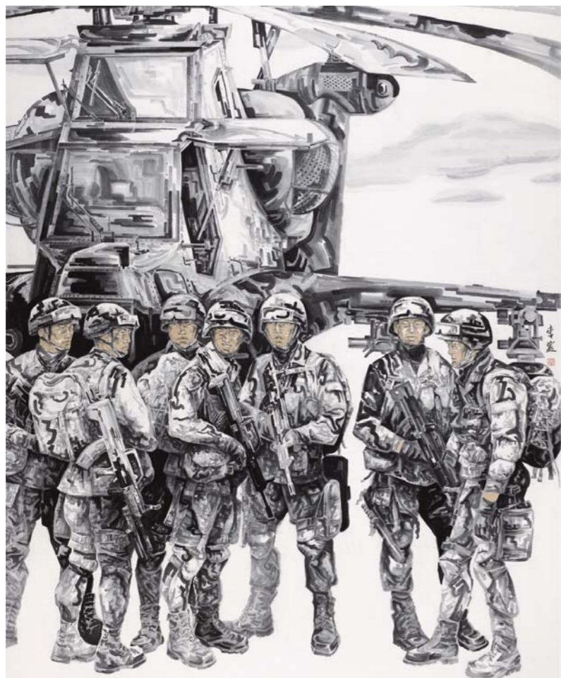
李岩 鹰魂 (国画)