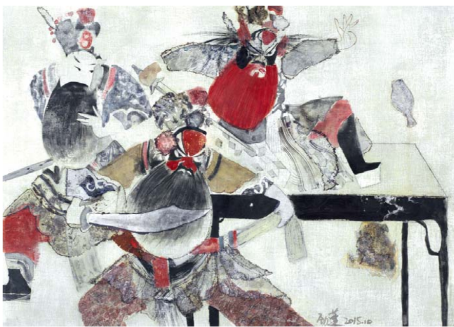
刘劲鹏 梨园·生之二 (综合材料)