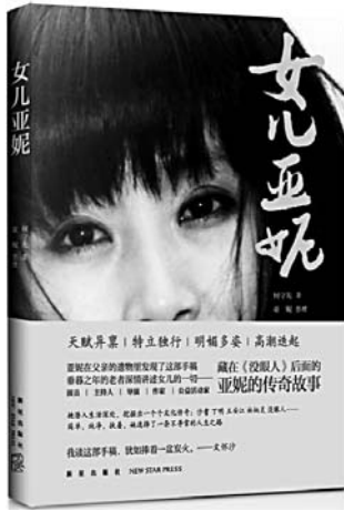
《女儿亚妮》 何守先 著 新星出版社

由于莫大的勇气和探险家们高超的航海技能，原本贫穷的葡萄牙在一个世纪里主宰了海洋。这是一部关于葡萄牙帝国崛起的完整叙述，雄心勃勃而狂热奋进的阿维斯王朝全副的光辉灿烂和凶狠残酷。