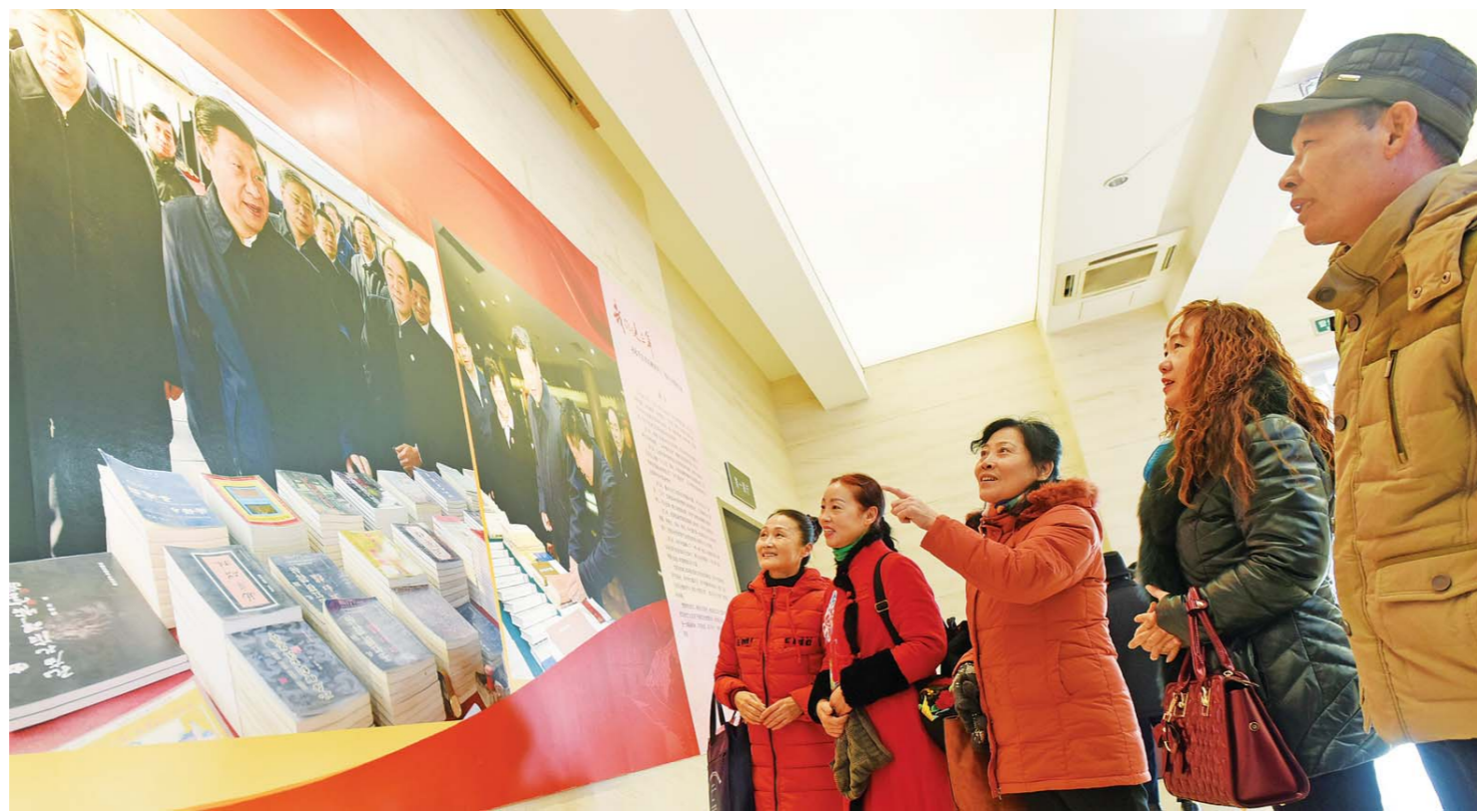
□记者 吕光社 通讯员 杨国庆 报道

对“百姓儒学”和“乡村儒学”，无论下多大力气都值得，这是济宁建设首善之区的一贯坚持，也是将优秀传统文化植根基层的重要举措。3年来，济宁大力实施优秀传统文化六进普及、道德提升、文明创建等七大工程，深入开展“儒韵民风”建设、弘扬优秀传统文化家风家训、新礼仪新风尚培育系列活动，创新推出了图书馆+书院、孔子学堂、尼山书院国学公开课等公共文化服务模式，广泛开展儒学进乡村活动，建成乡村社区儒学讲堂1058处，聘请儒学讲师93名，组织开