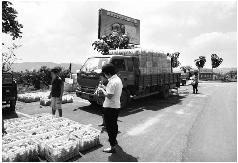
△专门设计的“停车港湾”，为果农卖果子提供了方便