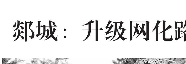
△干净整洁的村村道路