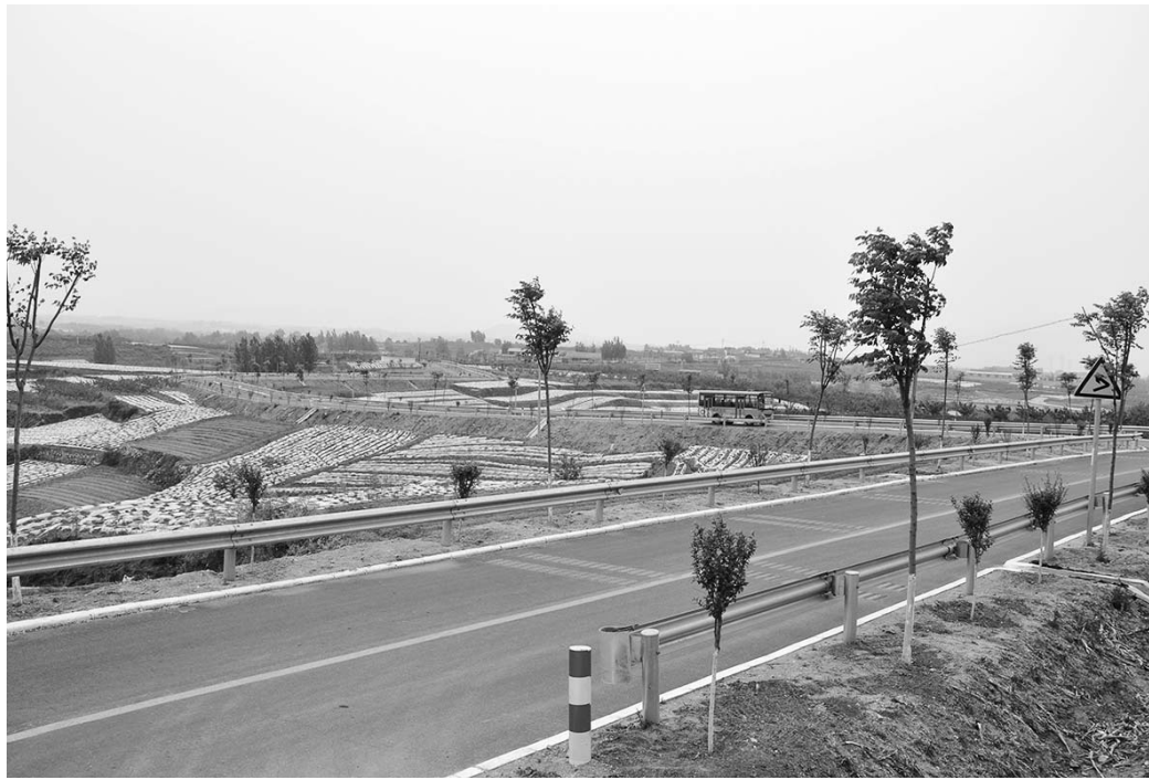
△标志清晰、安防设施齐全农村公路

初冬的沂蒙大地，依然生机勃勃。在沂蒙山深处，连接孟良崮和山东沂蒙党的群众路线教育基地的“红色公路”如一条长龙盘旋于崇山峻岭之中，这条“红色公路”传承着沂蒙精神，渲染着红色文化，带动着旅游和经济社会各项事业的发展。这是沂南县推进幸福交通建设带来的新成效。