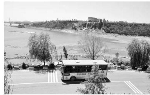
△道路干净整洁、公交安全畅通

圣汤泉、诸葛亮公园、北寨汉墓等一大批旅游景点实现了整体开发。如今，这条公路已成为红色教育文化带、绿色生态风光带和农业产业经济带，到沂南旅游的游客络绎不绝。