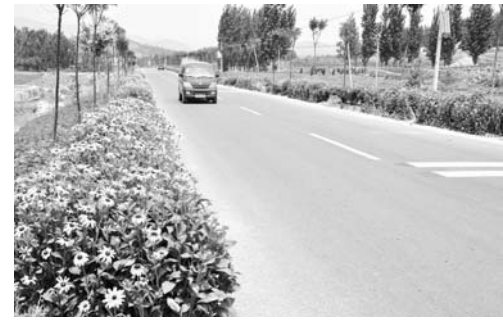
△车在路上行，如在画中游

纷纷落户沂南，开花结果。以交通促进旅游业发展。沂南县委、县政府坚持把交通道路建设与旅游开发相结合，2013年投资1.2亿元，经过半年的艰苦奋斗，建成了一条在沂南长19公里的红色专线，道路的建成，使孟良崮、抗大一分校、沂蒙影视基地、凤凰刻、香山湖、红石寨、竹泉、智