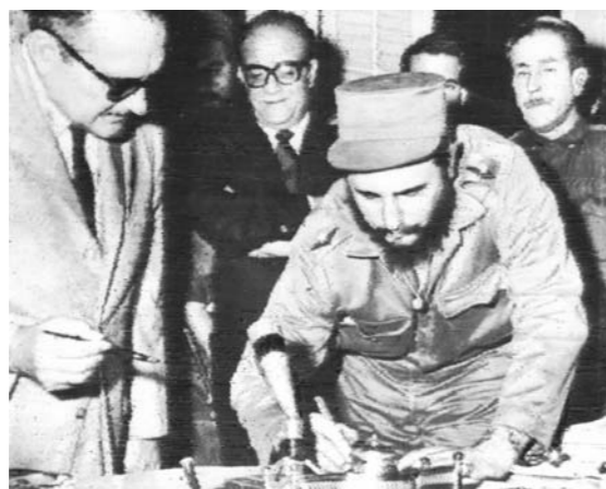
1959年2月16日，菲德尔·卡斯特罗在哈瓦那就任政府总理时在就职文件上签字。