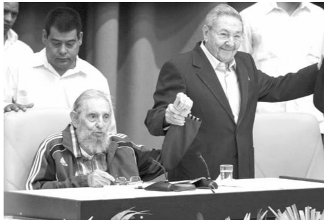
2016年4月19日，在古共第七次全国代表大会上，菲德尔·卡斯特罗(前左)和古巴国务委员会主席劳尔·卡斯特罗拉手致意。