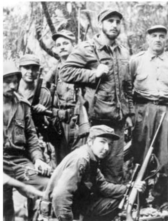
1958年，劳尔·卡斯特罗(前)、菲德尔·卡斯特罗(右二)和切·格瓦拉(左二)等开展游击战争。