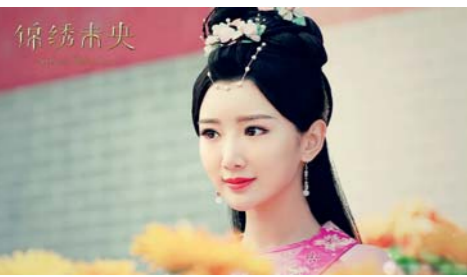
毛晓彤《锦绣未央》剧照