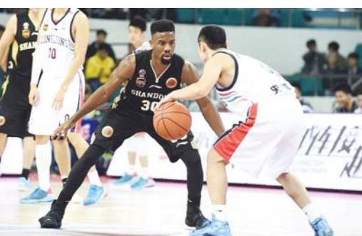
高速男篮外援科尔(右二)在比赛中

当地时间11月24日，电影《西班牙女王》首映式在马德里卡利亚奥影院举行。图为演员佩内洛普·克鲁兹(左)和奇诺·达林出席首映式。