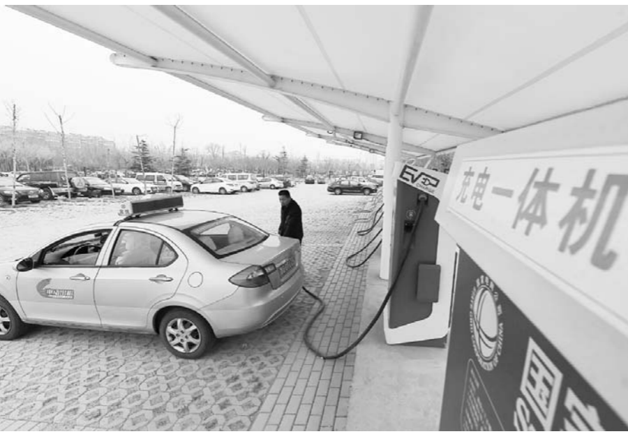
在青州市,一位司机在充电站为汽车充电。

“我省将按照新能源汽车推广应用城市公共充电桩与电动汽车配置比例不低于1:1,其他城市公共充电桩与电动汽车配置比例不低于1:12,每2000辆电动汽车至少配套建设一座公共充电站的原则配置。”省发改委能源处负责人介绍。