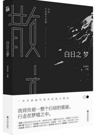
《白日之梦》 袁琼琼 主编 九州出版社

7种不同组合赋予了7种元素完全不同的个性每一种都以引人注目姿态出现,并带着强烈的使命感存在,与我们息息相关。元素在促进人类繁荣的同时,也改变着人类的本性,引发人性中最黑暗的一面。