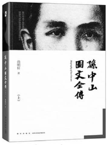
《孙中山图文全传》 尚明轩 著 新星出版社

泰斗级学者、95岁尚明轩先生以孙中山的思想和生平活动为主线,吸收最新的史料和研究成果,以631幅具有代表性的历史图片、照片、题词遗墨等,与正文相互对照,生动地反映孙中山的活动和社会交往。