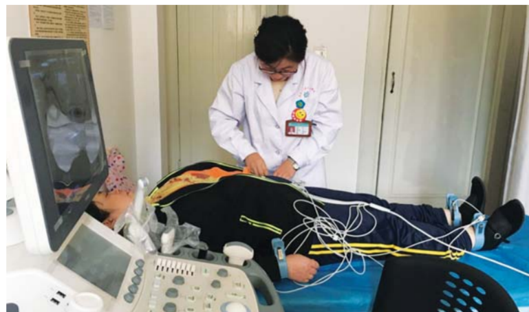
△中山路街道社区卫生服务中心内医生正在为患者做心电图检查

作为一种新型医疗服务体系，医联体实现了“首诊在社区、大病到医院”的分级诊疗。社区卫生服务机构与二级以上医院间签订《区域化医联体协议》，免费为居民建立医联体内部检验、检查、转诊、预约等绿色通道，实现信息交互与共享。上级医院指派专家定期到社区卫生服务机构开展诊疗服务、健康知识讲座，对社区卫生服务机构医务人员进行技术指