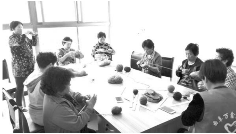
曲阜万鑫社区“益爱编织坊”的成员们正在利用废旧毛线为环卫工人和社区困难群体编织手套、围脖。

“社区自治金”制度自今年6月底启动以来，共成立了27个社区公益组织，开展了爱老、助残、志愿服务等公益活动，设立了美发、水电暖维修等居家服务项目，成立了编织、书画、舞蹈等兴趣小组，还在邻里调解、维护环境卫生等方面发挥着积极作用。短短3个多月，社会组织已开展各类活动280多次。