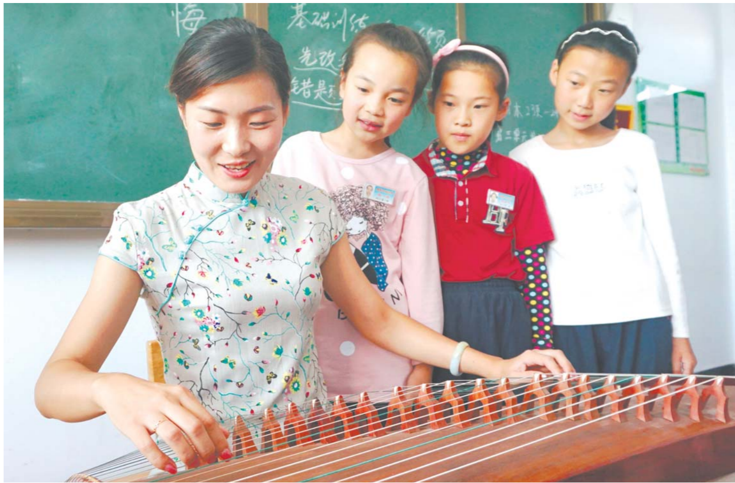
10月28日,惠民县何坊街道一学校的活动室里,孩子们正在老师的指导下学习古筝技艺。惠民县“非遗进校园”项目向城郊及乡村中小学展开,说书、京戏、梆子、泥塑、民乐等各种社团丰富了学生的学习内容,让他们在充满乐趣的活动中感受传统文化的魅力。

省文化厅副厅长张桂林说,本次展览艺术家阵容庞大、作品精彩纷呈,是近年来难得一见的国家级写实油画艺术大展,是全国油画界为齐鲁百姓带来的又一场文化大餐,对满足山东群众日益增长的精神文化需求,推动山东油画事业的发展进步,都具有非常重大的现实意义。