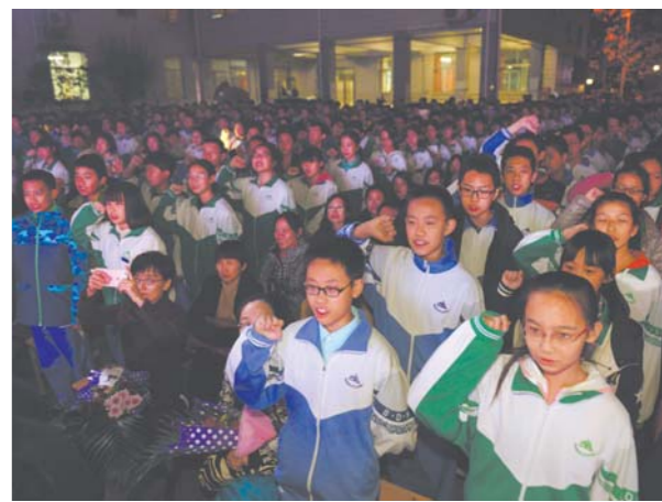
□记者 李勇 报道 10月28日,1000名初中学生在山东大学附中举行的十四岁成人典礼上庄严宣誓。典礼仪式上,老师和家长对跨入青春大门的莘莘学子表示祝贺,并要求大家做一个品德高尚、懂得感恩、勇于追梦的人。