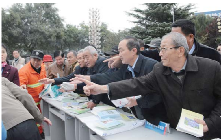
△市民在现场踊跃领取书籍，学习热情高涨