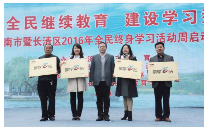
△启动仪式上，2016年新建成“泉学e站”获得授牌

核心提示： “全民终身学习”在提高人的综合素质和幸福指数，提升城市的核心竞争力、持续发展力，建设小康社会等方面发挥着重要作用，已逐渐成为各地精神文明建设的重要发力点和发展战略选择。自2005年起，教育部每年10月份都会在全国范围内举办全民终身学习活动周，以期加快全民学习、终身学习的学习型社会建设。而济南市是全国开展此项活动较早的城市之一，多次获得“全国先进组织奖”等奖项，市内各区及市民多次获得全国表彰奖励，在建设学习型城市、普及全民终身教育方面更是走在了全国前列。10月28日，济南市暨长清区2016年“全民终身学习活动周”启动，旨在进一步营造人人学习、时时学习、处处学习的良好氛围，为“打造四个中心，建设现代泉城”的战略目标作出新的贡献。