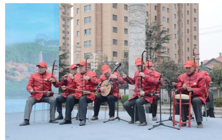
△终身学习成果展现场，市民们演奏着民族经典，向人们展示才艺

开展百姓学习之星等典型事迹宣传活动，用身边的人、身边的事去鼓舞人、激励人，传递正能量，不断提高全民终身学习的参与率；向社会公告部分社区教育学校的服务水平与社会利用效果；各社区教育学校面向社区居民开展多种形式的社区教育培训和活动，举办“民校为民——社区教育共建活动”，鼓励和支持培训学校积极与当地社区结对共建，开展公益培训及活动，积极营造全民终身学习的良好社会氛围。