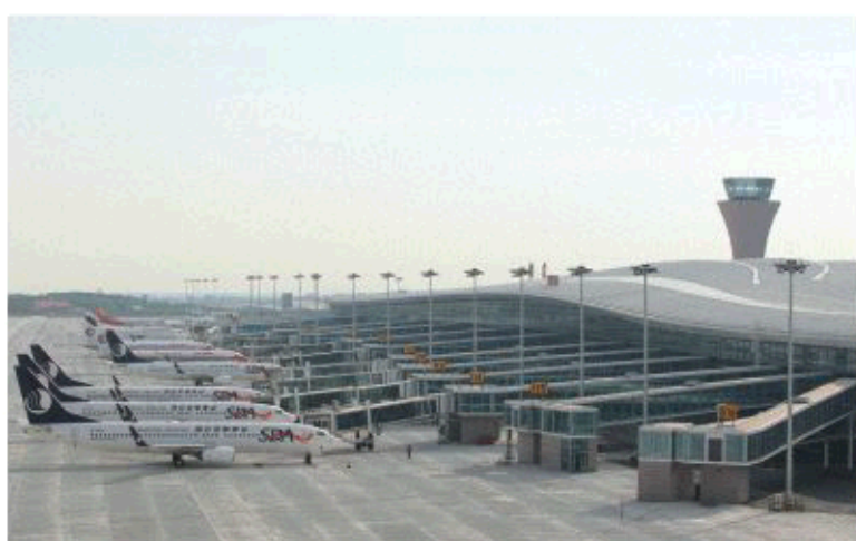
△“海陆空”大交通共建胶东枢纽城