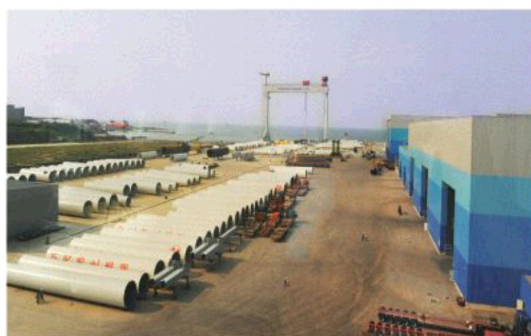
△以海上风电设备制造为代表的装备制造制造业快速崛起

——新材料产业:蓬莱现有金属材料、精细化学品、高分子材料、建筑装饰材料等企业55家,拥有1家省级工程技术研究中心、3家烟台工程技术研究中心,80%企业拥有专利技术和新型产品。承载新材料产业的北沟新材料产业