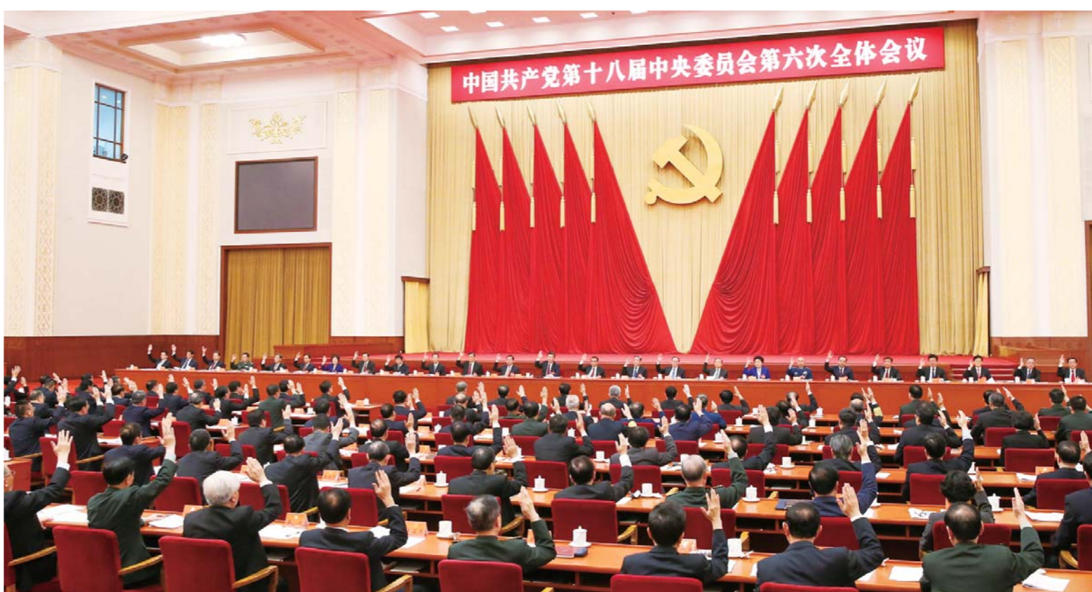
中国共产党第十八届中央委员会第六次全体会议，于2016年10月24日至27日在北京举行。中央政治局主持会议。