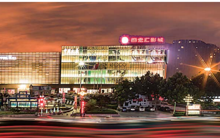
△古德广场：高新区商业中心，满足周边居民购物、休闲、娱乐等全方位需求

这里的居民们每周都能欣赏到社区的“艺馨艺术团”带来的曲艺、舞蹈、乐器、合唱等等演出；这里有1400多平方米的文化活动室，供居民们剪纸、舞蹈、唱歌、书画；这里成立的剪纸协会、富华艺术团、老干部艺术团等文艺团体，丰富了居民的文化生活；这里坐落着潍坊市图书馆、市青少年艺术中心、市工人文化宫、保利大剧院等文化资源，为文艺爱好者搭建平台。