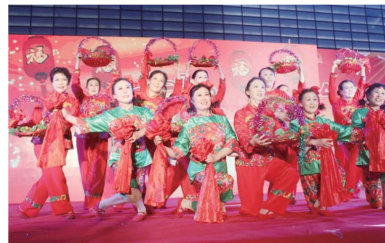
△新城街道各类文化活动丰富了居民生活

提起富华社区，不得不说到它的文化惠民，通过打造的“艺馨”服务品牌，让文化基因在社区生根。