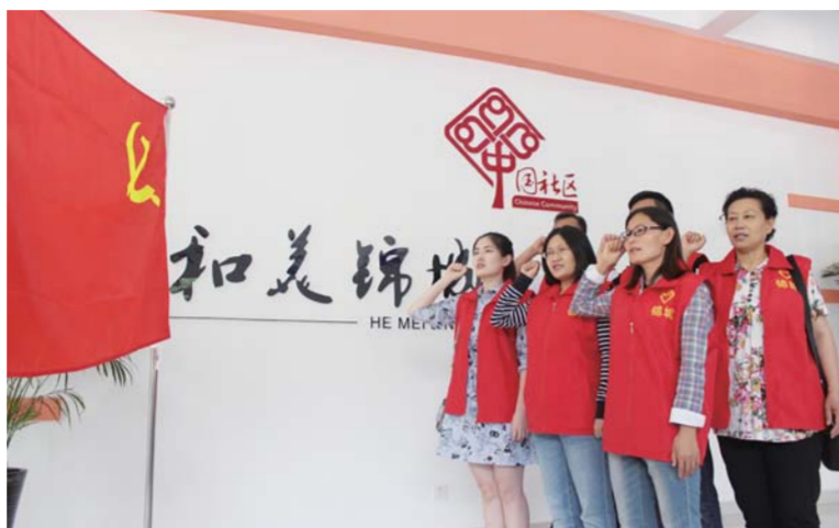
△锦城社区党员代表在“两学一做”学习教育中重温入党誓词

积110平方公里，新城31.1平方公里；高新区户籍人口24.2万，新城街道17.4万；高新区所有的城市社区都在新城街道，最重要、最核心的大项目也几乎都在新城街道。新城，是高新区的精华所在。