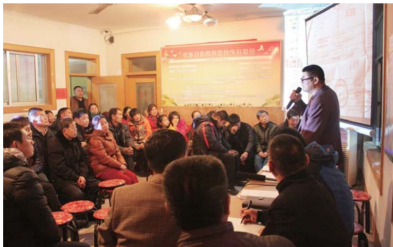
△东金麻社区在全区率先推行晒单制度，这只是新城社会治理探索的一个缩影