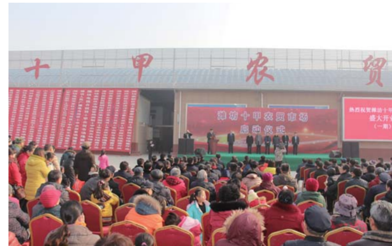
△2015年12月26日，十甲农贸市场正式开业，大大增加了社区集体经济收入