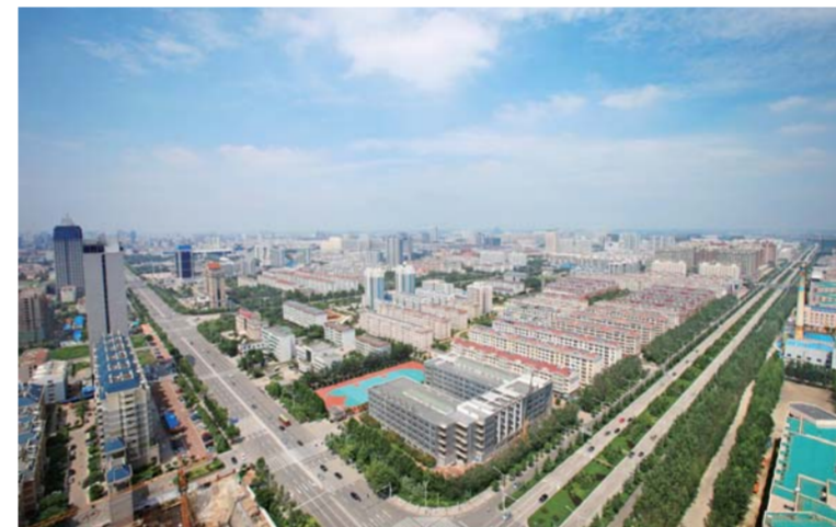
△经济正在崛起的新城街道全景