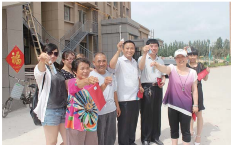
△山后郑家社区居民开心地拿到回迁房钥匙