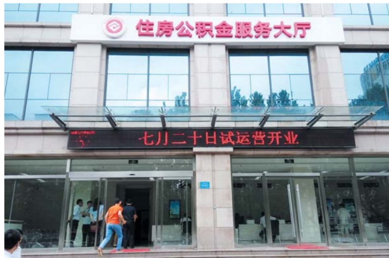
△济宁市住房公积金高新区服务大厅于7月20日试运营开业

定，缴存职工一旦被纳入“黑名单”，将取消其5年内的住房公积金消费类提取和贷款资格。若在限制期内再次发生违法违规情形的，自发生之日起重新计算限制期限。除缴存职工外，合作单位以及缴存单位有违规行为，同样会被纳入“黑名单”。对纳入诚信“黑名单”管理的合作单位，取消其5年内住房公积金相关业务的承办资格。诚信黑名单制度的实施，有效规范了住房公积金业务，防范了骗提、骗贷行为。