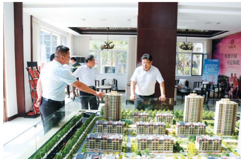
△济宁市住房公积金管理中心负责人现场考察住房公积金贷款备案楼盘

管理机构经费后，累计上缴城市廉租住房保障建设补充资金6.71亿元。2015年当年实现增值收益4.69亿元，上缴城市廉租住房保障建设补充资金2.56亿元。住房公积金通过增值收益分配，大力支持了济宁市保障房建设。