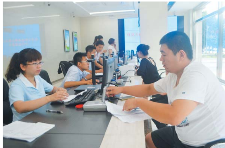
△济宁市住房公积金管理中心工作人员为市民办理业务

截至2015年底，济宁市住房公积金累计实现增值收益14.05亿元，扣除贷款风险准备金及