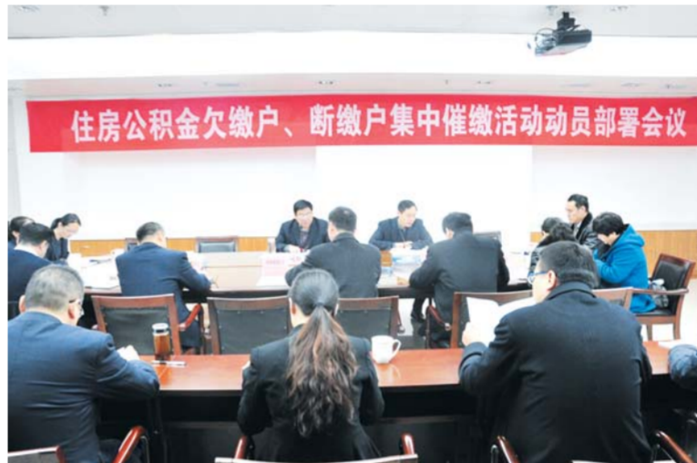
△部署开展住房公积金欠缴户、断缴户集中催缴活动

出台诚信黑名单制度。住房公积金管理委员会第19次会议研究通过《济宁市住房公积金诚信黑名单管理办法》，根据该《办法》规