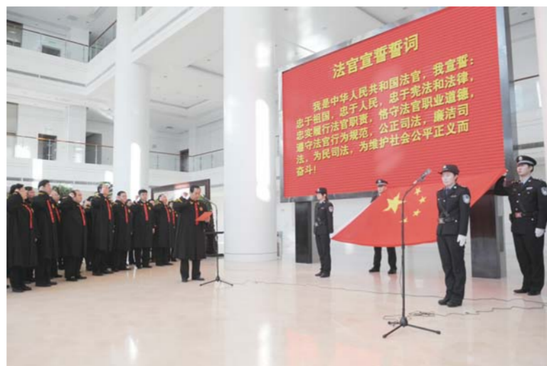
△济宁中院举办法官宣誓活动。重温法官誓词，坚定法治信仰，依法履行法官职责