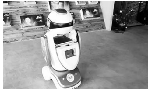
活动周上展示的新产品：机器人“创创”