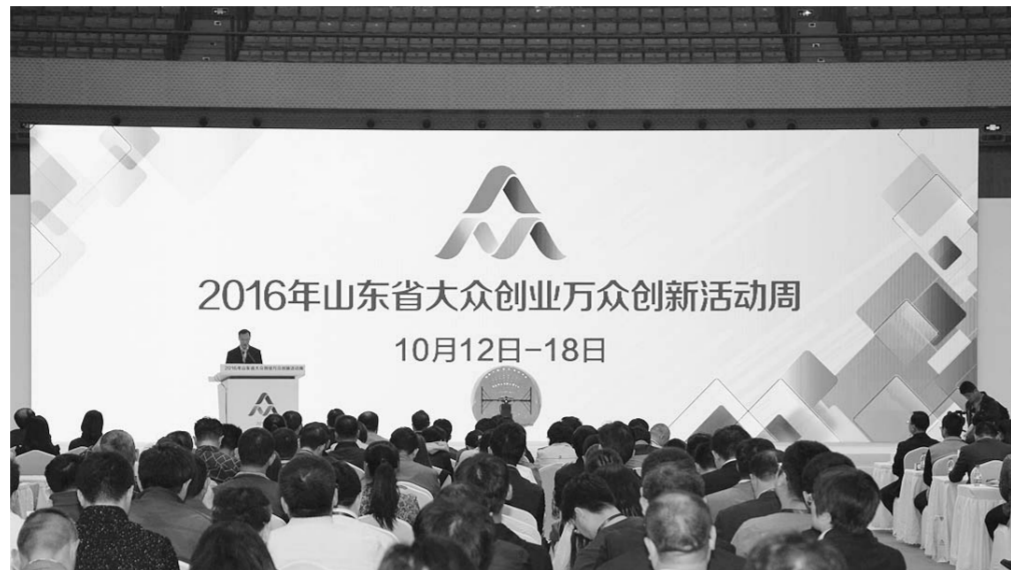
双创活动周启动仪式现场

时间：2016年10月11日—13日中午 地点：山东大学中心校区体育馆 目标任务：在全省征集“大众创业、万众创新”基础资料、实物模型、相关视频，进行筛选、确定、设计制作、安装，全面展示山东省“大众创业、万众创新”风貌。 展示内容： 1. 政策措施文件。各级重要批示批示、实地调研图片，双创政策措施文件。