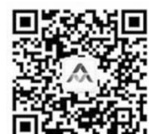
双创活动周官方微信

问： 省科协作为今年双创活动的联络员单位，结合单位自身性质和特点，围绕我省双创工作，做了哪些有特色亮点的工作？ 答： 今年年初，根据《国家发改委 中国科协关于共同推动大众创业万众创新工作的意见》精神和省委、省政府部署安排，省科协和省发展改革委联合出台了《山东省科协贯彻落实意见》，明确了省双创工作的目标任务、工作内容等，按照《意见》要求，结合省科协性质和特点，围绕双创工作重点开展以下几方面的工作。一是服务科技工作者学术创新，举办了泰山科技论坛。学术活动作为学术创新源头和活水，今年省科协确定了40期泰山科技论坛，邀请院士40余名，一百余名长江学者、泰山学者等全国知名专家，围绕学科发展和建设开展研讨、交流，对于全省科技类学会的学术创新起到了很好的作用。二是服务企业技术创新，实施了创新驱动助力工程。目前省科协所属科技类学会近150个，联系了全省的科技工作者近60万名。实施创新驱动助力工程，就是发挥好学会人才和智力优势，服务全省大中小企业，解决相关技术难题，促进企业技术创新。三是服务大学生创新创业，举办了大学生科技节。围绕高校学生创新创业，省科协联合省发改委、高校工委、教育厅等部门举办了大学生科技节，包括创新创业赛事活动39项，涉及全省所有高校，参加学生10万余人，极大地激发了大学生的创新创业热情。详细内容可以登录省科协官方网站做进一步的了解。