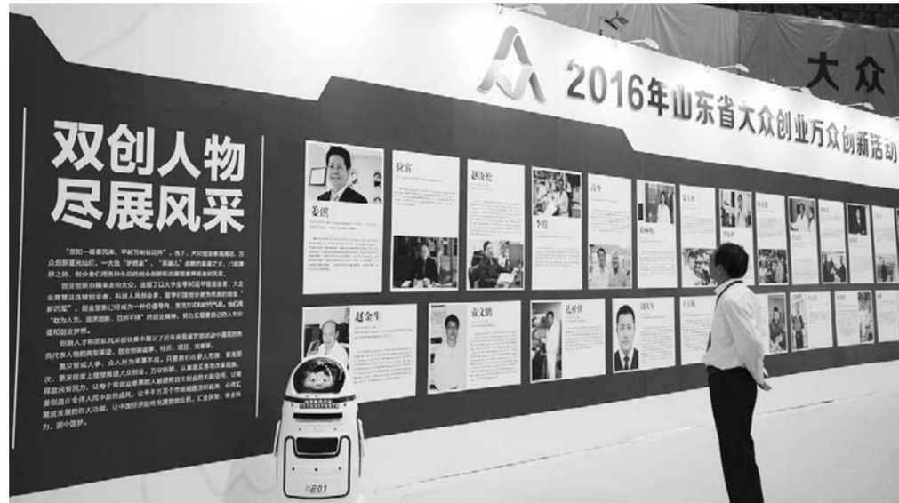
优秀创新创业代表人物风采展示

2. 新技术、新产品、新业态、新模式。一是实现科技成果转化的高新技术、新产品，能产生较大经济和社会效益，有效推动供给侧结构性改革。二是各类创客组织、协会、联盟、实验室、平台产生的优秀创客作品，包括应用、技术、创意、设计、文化等内容和主题。三是以市场为导向，技术、应用和模式创新相互融合，形成的新业态、新模式，促进分享经济发展。 3. 创新创业代表人物和团队。从科研人员、大学生、企业职工、农民工、退役军人、海外留学回国创业人才、境外来华创业人才等群体中涌现的双创人物、团队及创业导师群体的典型事迹和成果。 4. 创新创业载体平台。一是全省各类双创园区在完善政策环境、推动政策落地、构建双创生态等方面取得的成果和先进经验。二是双创孵化平台，包括各类创客空间、创新型孵化器、企业创业平台、创业投资平台、开放式技术平台、创客联盟、市场化网商创业平台、创新助力工程示范区等。三是双创公共服务平台，包括双创教育平台、创业政策集中发布平台，各类公益讲坛、创业论坛、创业培训等活动，各类创新创业大赛，中小企业公共服务平台等。具有良好的双创机制、生态环境和典型案例，双创的引领、示范、带动作用显著。 展示形式：主题展示将整体设计，统一