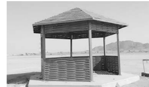
建筑节能节能型木塑地板