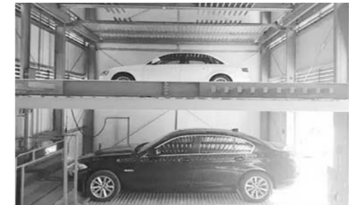
智能梳齿平面移动式立体车库