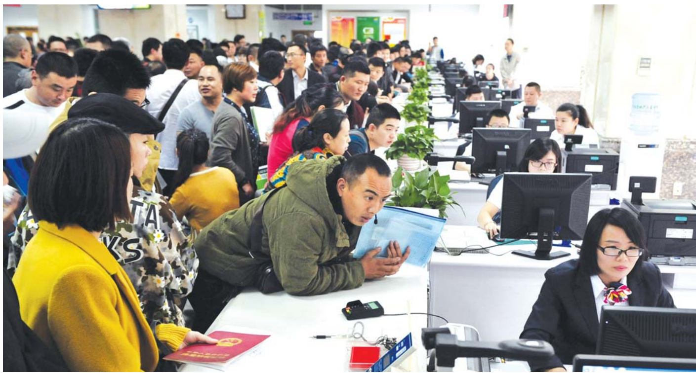
10月8日，济南房产交易大厅人头攒动。楼市调控新政出台后，房产交易大厅的“限购查询”窗口也重出江湖。