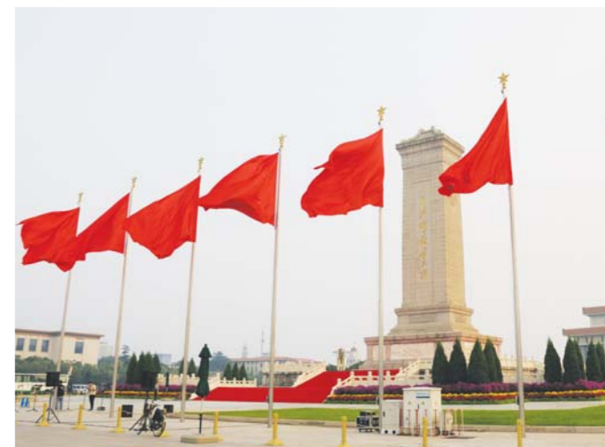
在北京天安门广场,人民英雄纪念碑四周鲜花松柏环绕。

新华社北京9月28日电 9月30日是国家设立的烈士纪念日,正值中国工农红军长征胜利80周年之际。当天上午,党和国家领导人将同首都各界群众代表一起,在天安门广场向人民英雄敬献花篮。届时,中央电视台将进行现场直播。