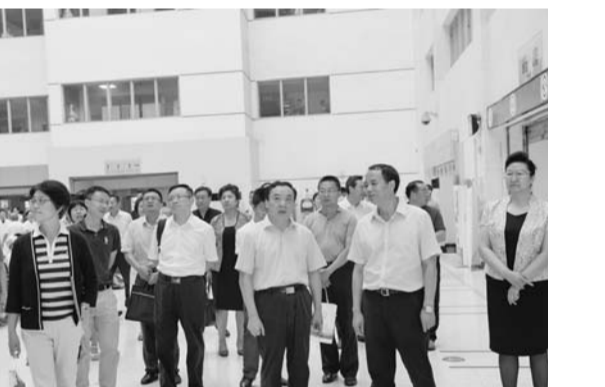
△国家卫计委副主任王培安(右二)一行来院调研公立医院综合改革,对省千医各项工作给予充分肯定。

孙洪军:医学是人文滋养的科学,最具生命温度,是人性牵引的技术,是技术和人文相结合的一门学科。