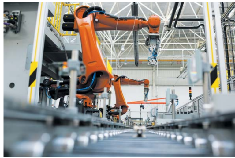
△北汽海纳川滨州年产10万套汽车发动机缸体、缸盖项目已投产

业,依托全国工商联及各行业商会、省驻京办事处、北京山东商会及其他商会、协会,先后组织开展了3次大型经济合作座谈会,并组织参加了津洽会、2015中国京津冀地区产业转型升级、重点企业项目合作投融资交流会、“京鲁经济合作论坛暨北京山东企业商会十周年年会”、中国发展高层论坛“山东之夜”主题活动。同时,举办了全国工商联五金机电商会知名民营企业走进滨州活动和北京知名企业家走进滨州活动,既有效扩大了滨州对外影响力,也洽谈签约了一批大项目、好项目。