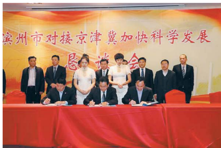
△滨州市对接京津冀加快科学发展座谈会在北京举行

滨州有着良好的产业基础,经过多年努力,滨州已经形成了冶金、纺织、有色金属、海洋石油化工、机械制造、粮食加工等优势主