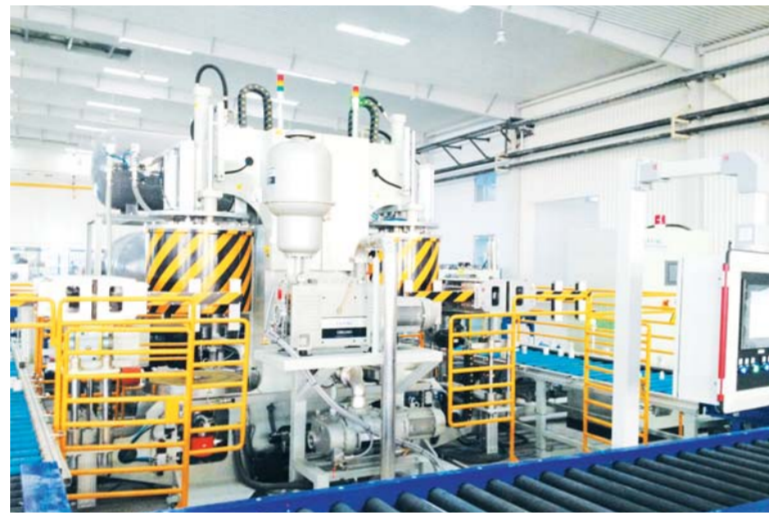
△中信威威戴森年产600万只个性化轮胎生产线

导产业,成长起了魏桥集团、西王集团等一批在全国乃至世界知名的大型企业集团。今年,山东魏桥集团在“2016年世界500强企业排行榜”中,以2015财年530.261亿美元的营业收入、11.209亿美元的净利润,位列第163位,比2015年跃升了71个位次。目前,全市电解铝产能达到数百万吨,粮食加工能力达到1100万吨,产业链从玉米油、大豆蛋白等食品领域延伸到了水葡萄糖、无水葡萄糖等医药领域。此外,滨州的原油加工能力、纺纱能力也分别达到了1800万吨和1100万锭。现在,依托魏桥、京博、西王、滨化等骨干龙头企业,滨州正在加快打造5000亿元级高端铝产业集群、2000亿元级新型化工产业集群、1500亿元级粮食加工产业集群、1300亿元级纺织产业集群、全球高端汽车轮胎制造中心和汽车轻量化材料基地。