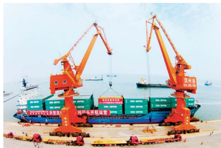
△滨州港是济南都市圈唯一的海港港口和山东对接京津冀的重要港口

区域经济的竞合,先声夺人至关重要。 自2014年京津冀协同发展实施以来,滨州市就抢抓机遇,把京津冀地区作为全市招商引资的重点区域,瞄准有外迁意向的世界500强企业、大型央企、民企及其他行业领军企