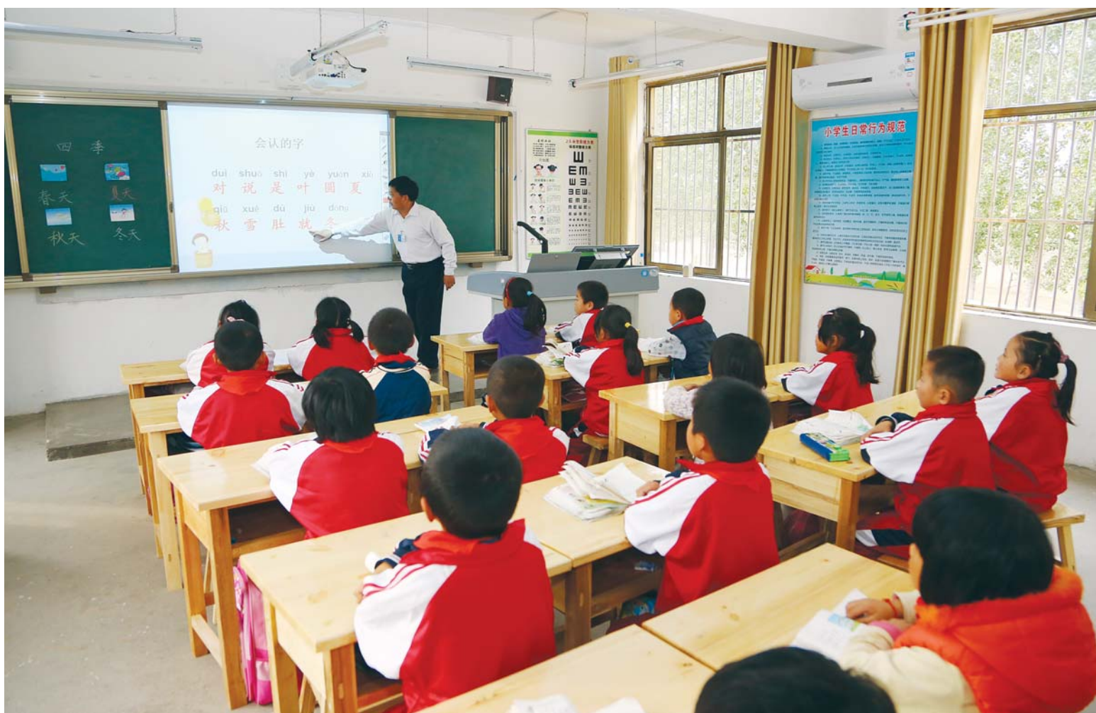
农村孩子如今也享受到了教育信息化带来的便利。

多措并举，解决乡村学科教师短板。提高乡村教师素质和待遇，增强乡村教师职业吸引力和职业荣誉感。加大补充力度，做到“有编即补”。调整完善中小学岗位设置比例。乡村学校可在规定的比例上限再上浮1-2个百分点。