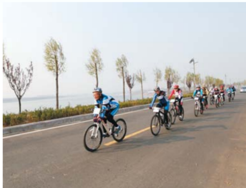
△环大沽河自行车公开赛

借力2015世界休闲体育大会的筹办，莱西市加快推进特色小镇、新型农村社区和美丽乡村建设，重点发展了一批休闲小镇、休闲农庄、休闲生态采摘园等，引进建设了一批休闲产业项目。其中，依托生态观光园、湖泊、湿地、河流等，规划建设了一批户外活动的景观和线路；依托“农家乐”、“渔家乐”、“采摘园”等，规划建设了乡村生态旅游线路。截至目前，该市累计新建改造乡村旅游点84个，发展国家A级旅游景区13家，全国休闲农业与乡村旅游示范点1处，国家休闲农庄4处，青岛市级以上旅游称号60余处，“休闲田园游”示范点40处。