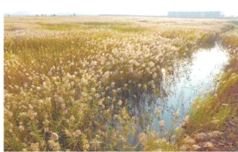
△威海南海新区城市湿地