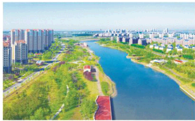
△威海南海新区城市一角

持续的生态绿化使威海南海新区先后获评联合国人居奖中国优秀示范新区、中国最佳旅游开发区、中国十佳生态文明城市等称号,地处五垒岛湾湿地公园内的香水河湿地公园于2014年被山东省林业厅评为省级湿地公园。今年1月,五垒岛湾湿地公园被国家林业局评为国家湿地公园。