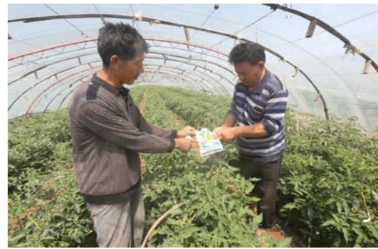
荣成市港西镇王官庄村村级协管员巡查农药使用情况。