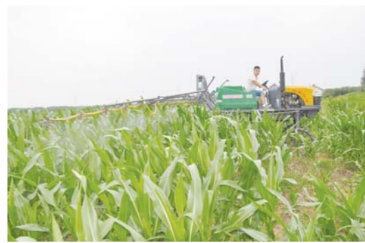
高密供销社初家为农服务中心工作人员在为农户庄稼喷洒农药。

作为中韩共建国际食品安全示范区的首个试点地区，威海实施了建立全国首家高毒农药全程追溯系统等多项创新举措，在农产品质量安全监管上走在全国前列。该市全面建立“预防为主，源头治理，全程监管”的农产品质量安全监管体系，标准化的生产理念贯穿了农业产前、产中、产后的全过程，质量安全监管覆盖了农产品生产、流通、消费等各环节。