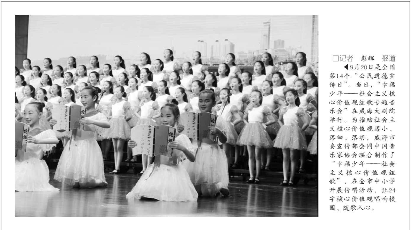
□记者 彭辉 报道 9月20日是全国第14个“公民道德宣传日”。当日，“幸福少年——社会主义核心价值观组歌专题音乐会”在威海大剧院举行。为推动社会主义核心价值观落地、落细、落实，威海市委宣传部分别与中国音乐家协会联合制作了“幸福少年——社会主义核心价值观组歌”，在全市中小学开展传唱活动，让24字核心价值观唱响校园、随歌入心。

近日，“阳光普照”家庭教育社会公益工程在淄博市高新区启动，高新区获价值688万元的家庭教育教材捐赠，6000多幼儿家庭将首批受益。据了解，近年来，淄博市家庭教育工作呈现出持续发展的良好态势。山东长征教育科技发展有限公司作为国内多媒体幼教细分市场占有第一的幼教龙头企业，目前已为全国近2万家幼儿园提供智慧幼教服务，全国累计超过1000万幼儿受益。该企业计划3年内为淄博市800余所幼儿园的10万幼儿家庭免费提供价值1亿元的“家庭教育”教材和线上育儿指导服务。(□马景阳 刘磊 报道)