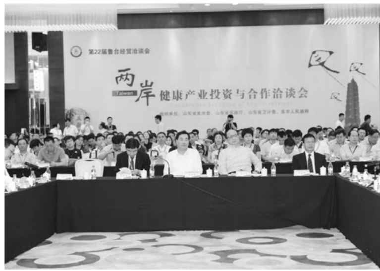
△两岸健康产业投资与合作洽谈会现场