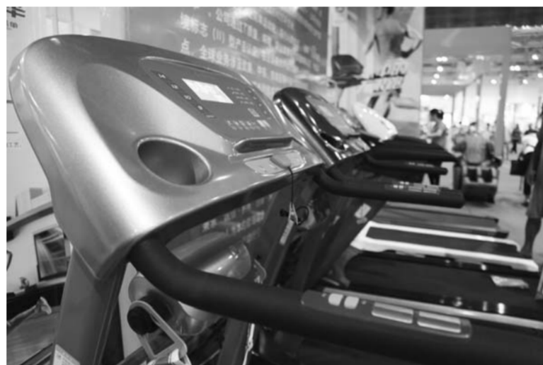
△海峡两岸博览会上健身器材展示

经贸、人文、科技、教育等方面的交流合作不断深化。目前，在潍坊已建有4个台湾园区，台资企业达到300多家，有6家潍坊企业在台湾投资兴业，潍坊港已实现对台直航，齐鲁台湾城成为国家级海峡两岸交流基地，大陆首家“963366”台商服务热线已开通运行，台商投资绿色通道和涉台金融、法律、生产、生活“四位一体”的服务机制已经建立。可以说，潍坊与台湾的经贸合作领域在不断扩大、热度在持续提升、成果越来越丰硕。