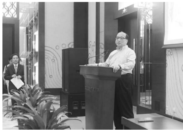
△中国国民党副主席胡志强致辞