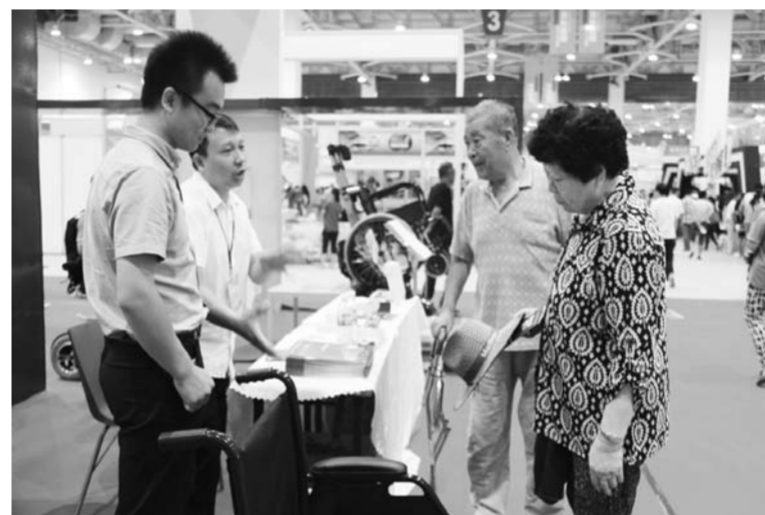
△健康产业成为市民关注的板块

设20处，其中有13处完成了主体建设，还有6处正在规划论证。体育健身运动设施日趋完善，人均体育场地面积达1.2平方米，中心城区建成十大健身活动片区，“十分钟健身圈”正在形成，全市在册单项体育协会272个，健身俱乐部300家，超过80%的行政村和90%的农村社区实现体育设施覆盖，“为身体健康而投资，为锻炼身体而消费”正在成为一种社会时尚和生活需要。