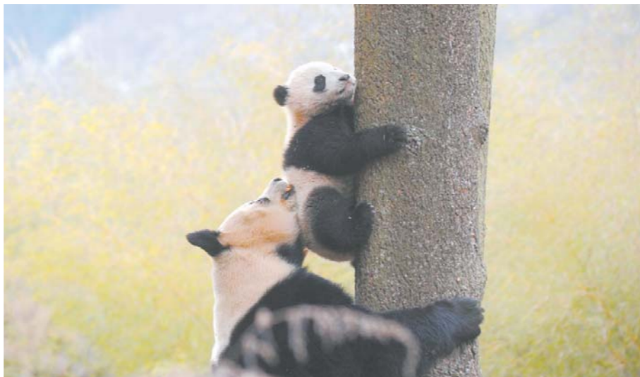
在中国大熊猫保护研究中心核桃坪野化训练基地,大熊猫妈妈“喜妹”(下)教它的孩子爬树(1月27日摄,资料照片)。