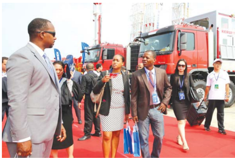
△中国(东营)国际石油石化装备与技术展览会