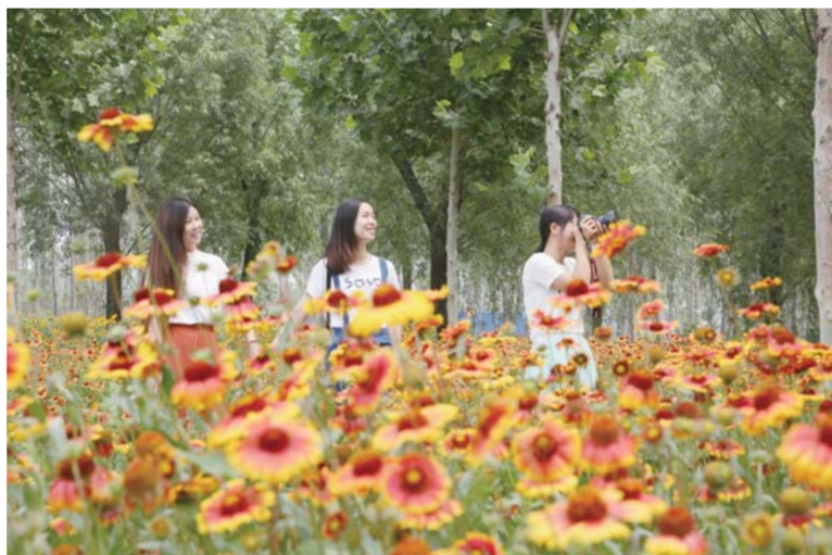
△文明乡村，人在画中游

区，以东营高新技术产业开发区为核心的生产性服务业集聚区、以东营区新区为核心的高端商务集聚区、以济南路中段为核心的商贸数码集聚区、以黄河口文化产业基地为核心的文化产业集聚区、以六户德大铁路转运集散中心和区新型农民创业园为核心的城南物流集聚区，以及以南二路为主线的文化旅游观光带。去年，东营区服务业实现增加值236.4亿元，占GDP的比重达54.6%，完成投资347.9亿元，同比增长14.8%，占全区固定资产投资比重的58.1%；实现地税收入15.65亿元，占到全部地税收入的71.2%；在全区74家综合纳税过千万元的企业中，服务业企业达到48家。