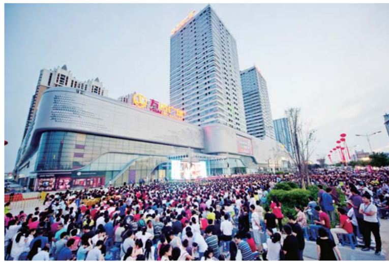
△现代服务业万达广场

东营区成立城市建设指挥部，确定了“一年见成效，两年出精品，三年大改观”的目标，今年确定建设及推进的项目共69个大项108