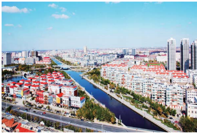
△生态宜居文明城市

抢抓融入京津冀协同发展战略机遇，东营区准备好了！近年来，东营区确定了建设生态宜居、美丽幸福的现代化新城区的奋斗目标，成绩显赫：石油装备产业傲居全球，全球首台仪表混砂车、享誉世界的快移钻机、名扬全国的液膜密封产品等，高端技术与产品数不胜数；现代服务业以高端企业的汇聚，高速运转的物流、人流、信息流、资金流等形成了黄河三角洲魅力产业基地；在生态建设领域，东营区建林场、造园林，在盐碱滩上谱写了绿化奇迹。