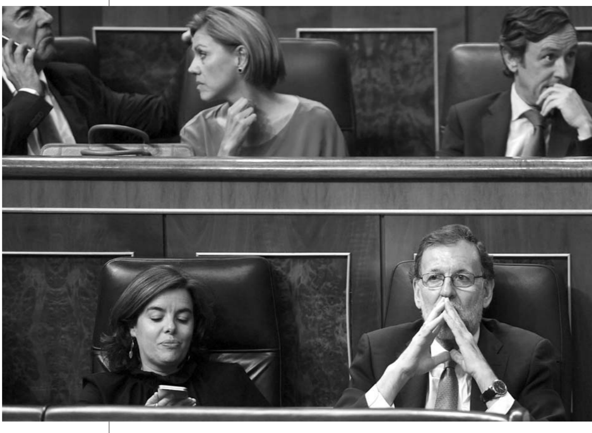
西班牙代首相 未过首轮信任投票

俄国防部官网消息说,俄军一架苏-34战斗轰炸机日前对叙利亚阿勒颇省“伊斯兰国”武装分子据点实施空袭,经多方证实,此次空袭击毙的武装人员中包括“伊斯兰国”二号人物阿德纳尼。