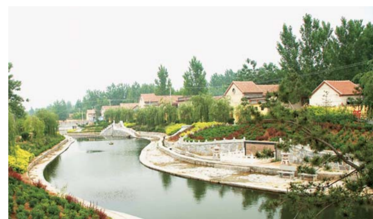
△水泉庄成梦里水乡