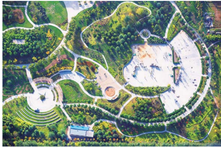
△新建改建农村文化广场4242处