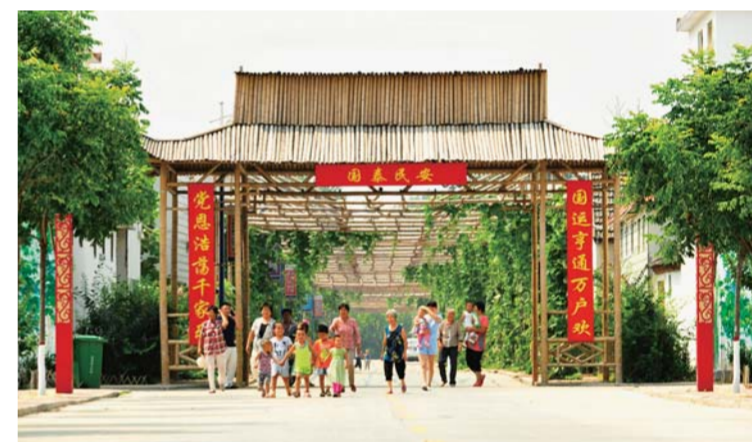
△美丽乡村改善农民生活环境

邹城还大力发展设施农业、休闲观光农业，加快建设香城、城前、中心店、石墙4处现代农业示范区，退耕还果还林规模达到35万亩，建成邹鲁生态园、绿鑫春等一批标准化生产基地。坚定不移实施“山区景区化”战略，成功创建4A级景区2处、3A级景区10处，省级旅游强乡镇、特色村29个，打响“邹东深呼吸”旅游品牌。（张长青 吕光社）