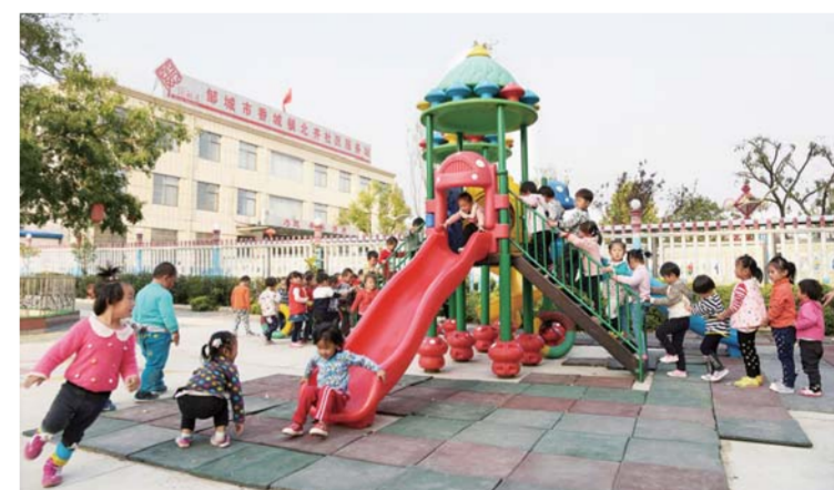
△不出村庄就上现代化幼儿园