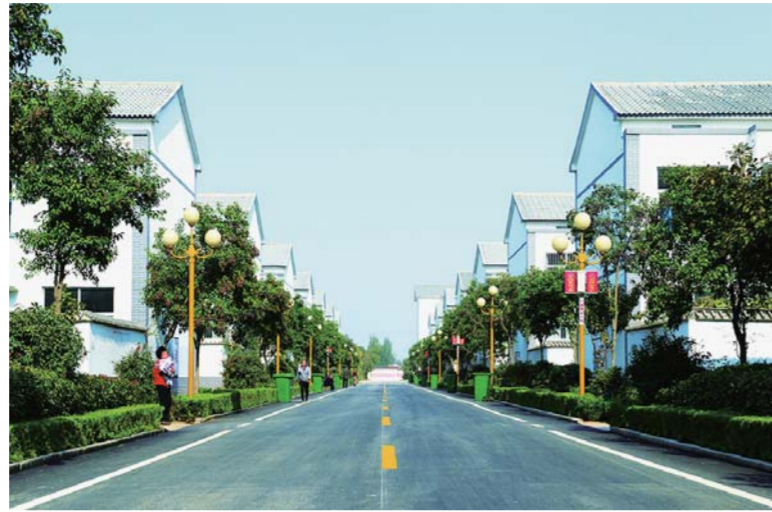
△硬化绿化亮化净化美化带来宜居环境