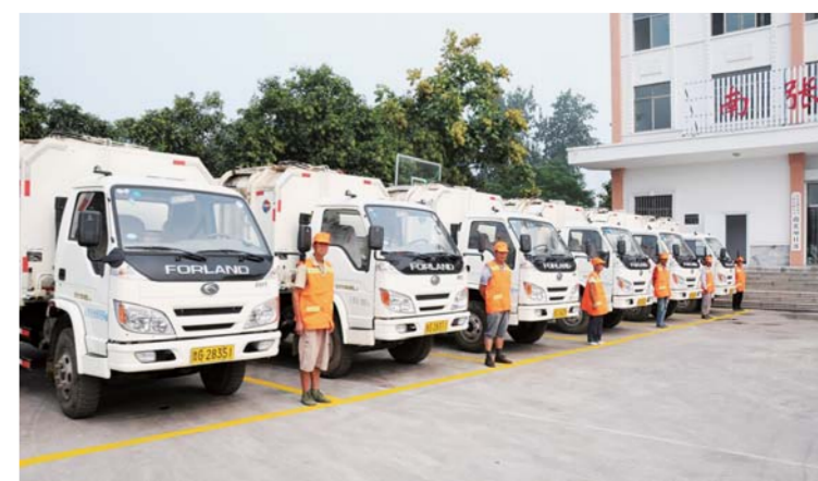
△农村垃圾集中清运处理