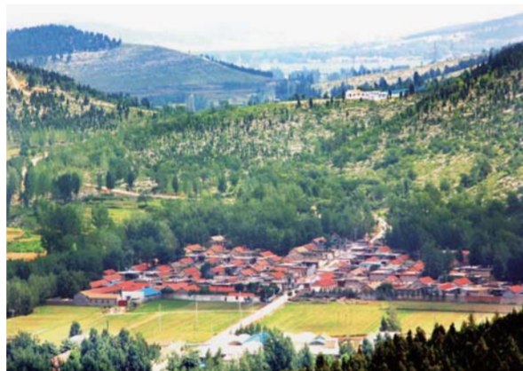
△小山村成世外桃源